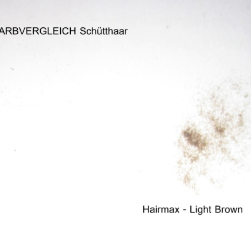
Hairmax - Light Brown

Subject: Aw: Schütthaar - Vergleich Posted by mrs.xy on Sun, 13 Nov 2011 18:59:19 GMT