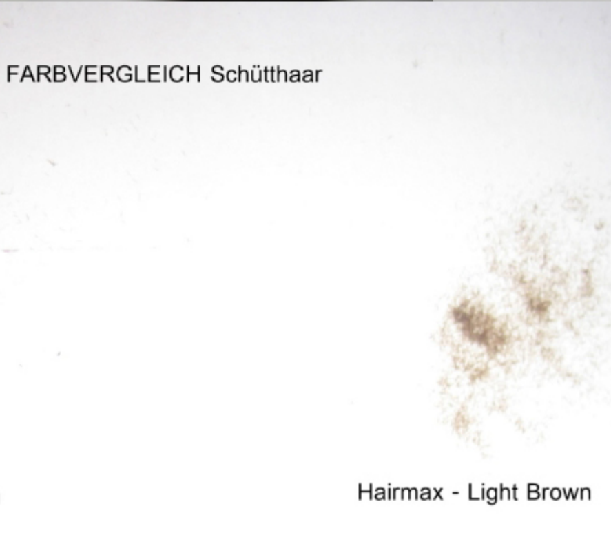
Hairmax - Light Brown

Subject: Aw: Schütthaar - Vergleich Posted by mrs.xy on Sun, 13 Nov 2011 18:59:19 GMT