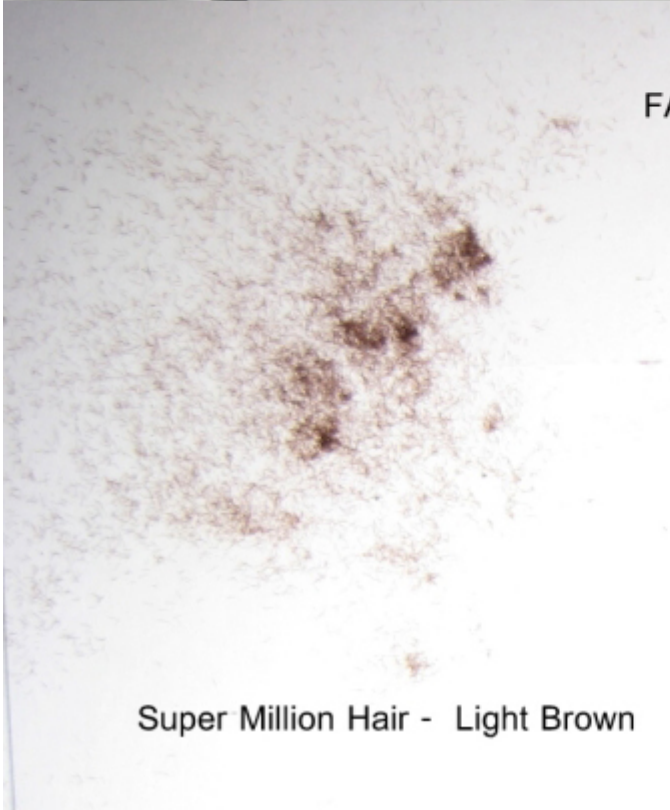
Super Million Hair - Light Brown