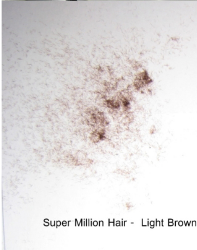
Super Million Hair - Light Brown