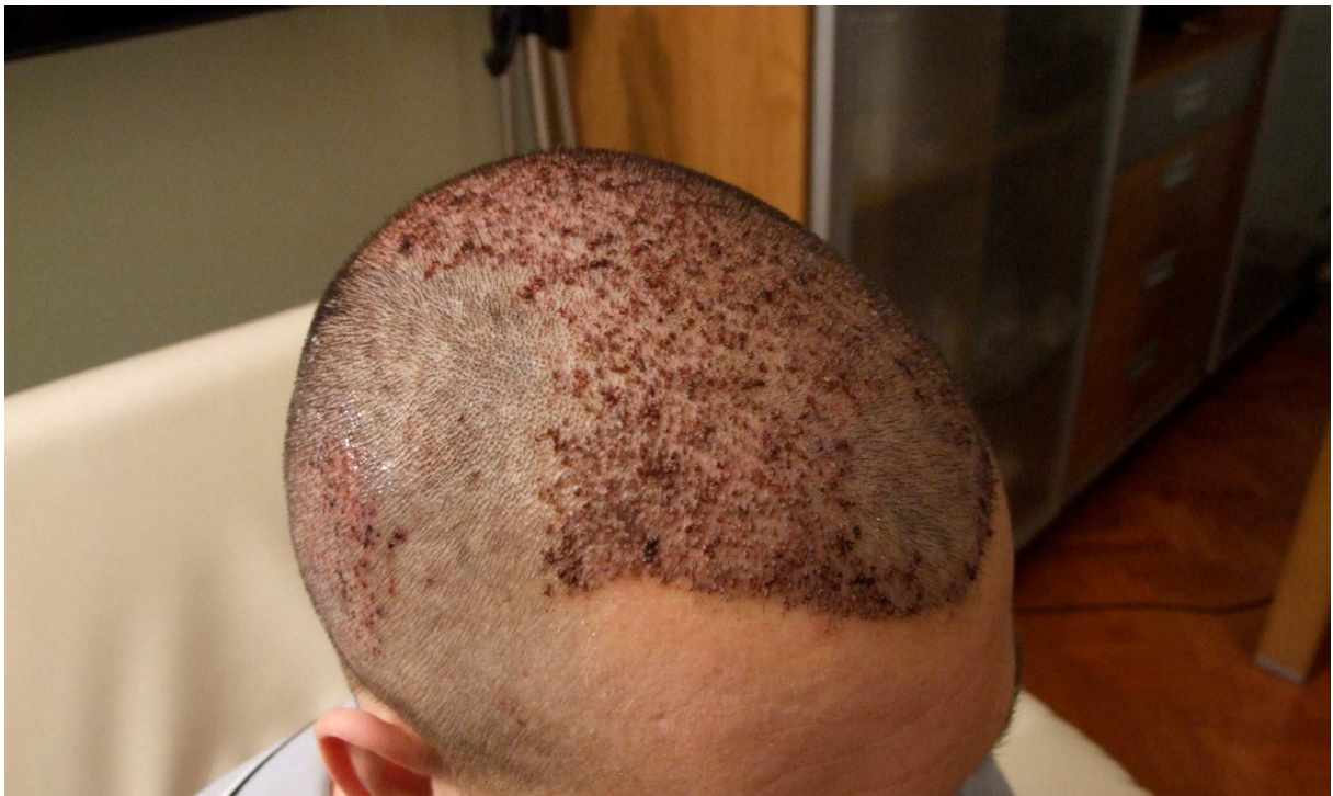
9: Nach der Kopfwäsche