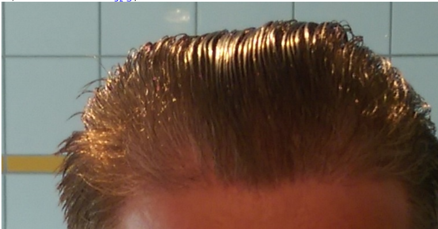
3) 21.06.15 halbtrocken.jpg , downloaded 1082 times