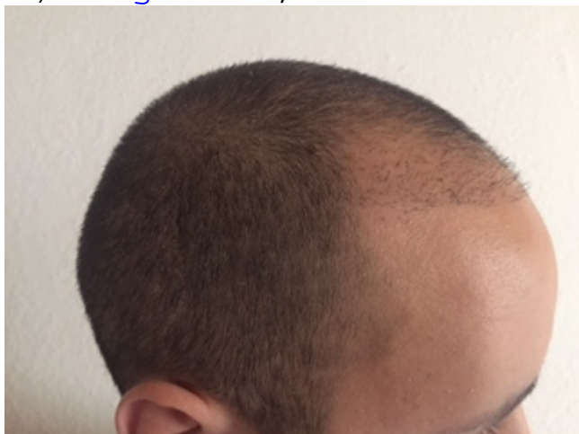
4) image4.JPG , downloaded 1467 times