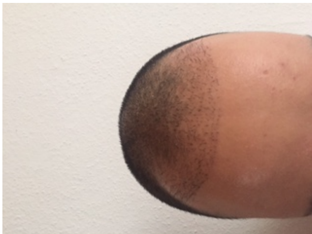
3) image3.JPG , downloaded 1556 times