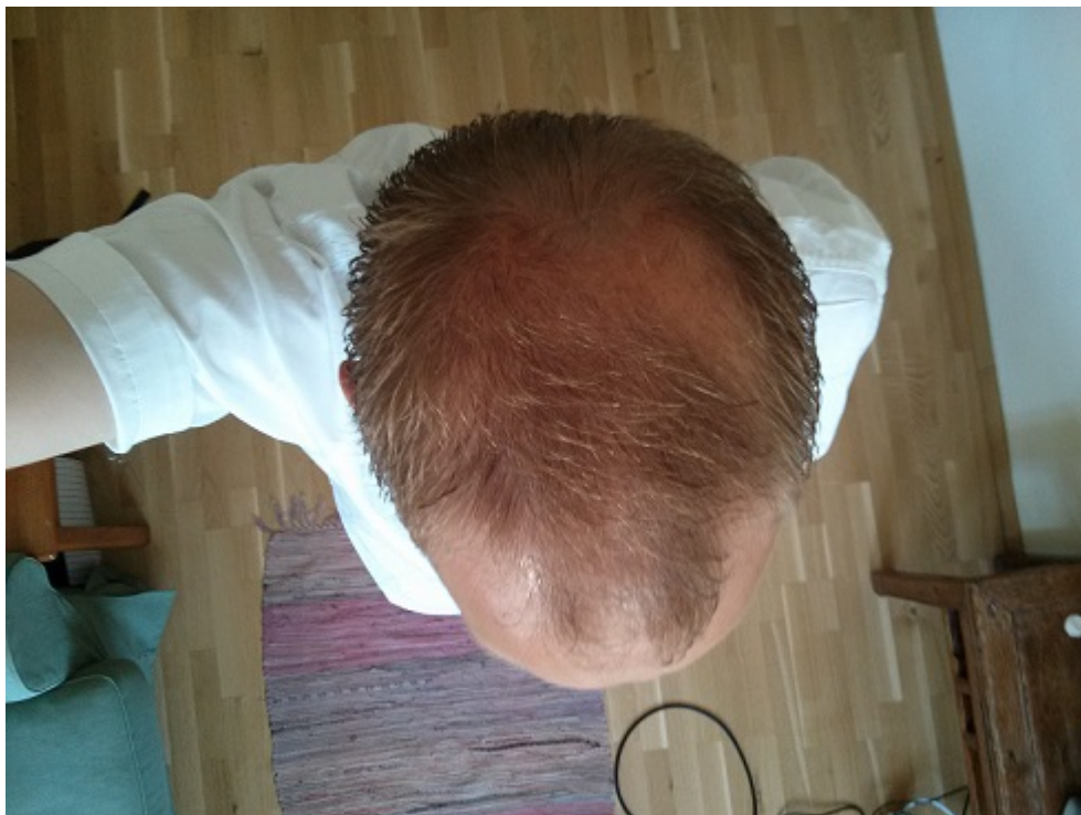
3) hinten.jpg , downloaded 1038 times