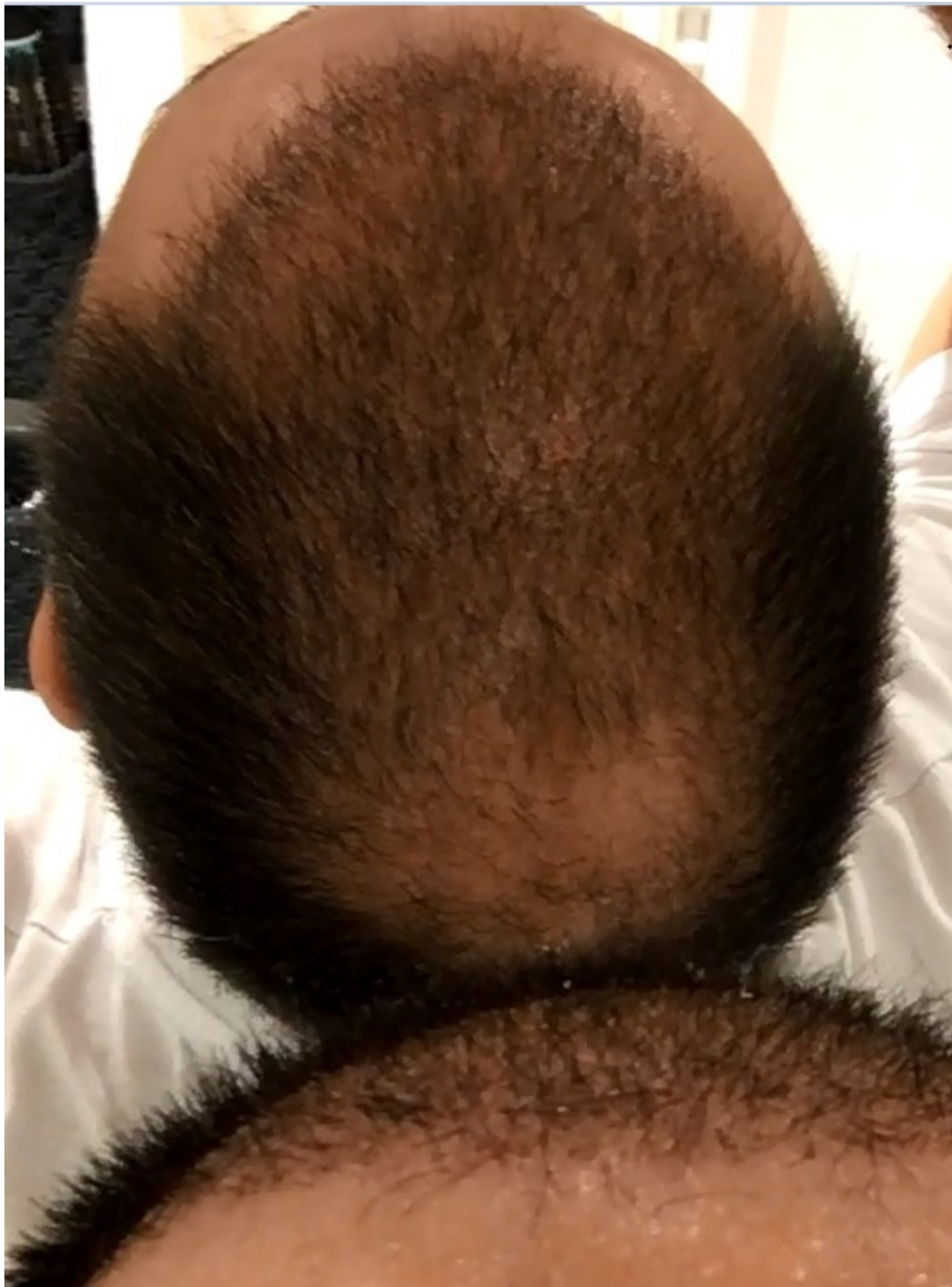
3) Bild Rückseite Woche 4.jpg , downloaded 585 times