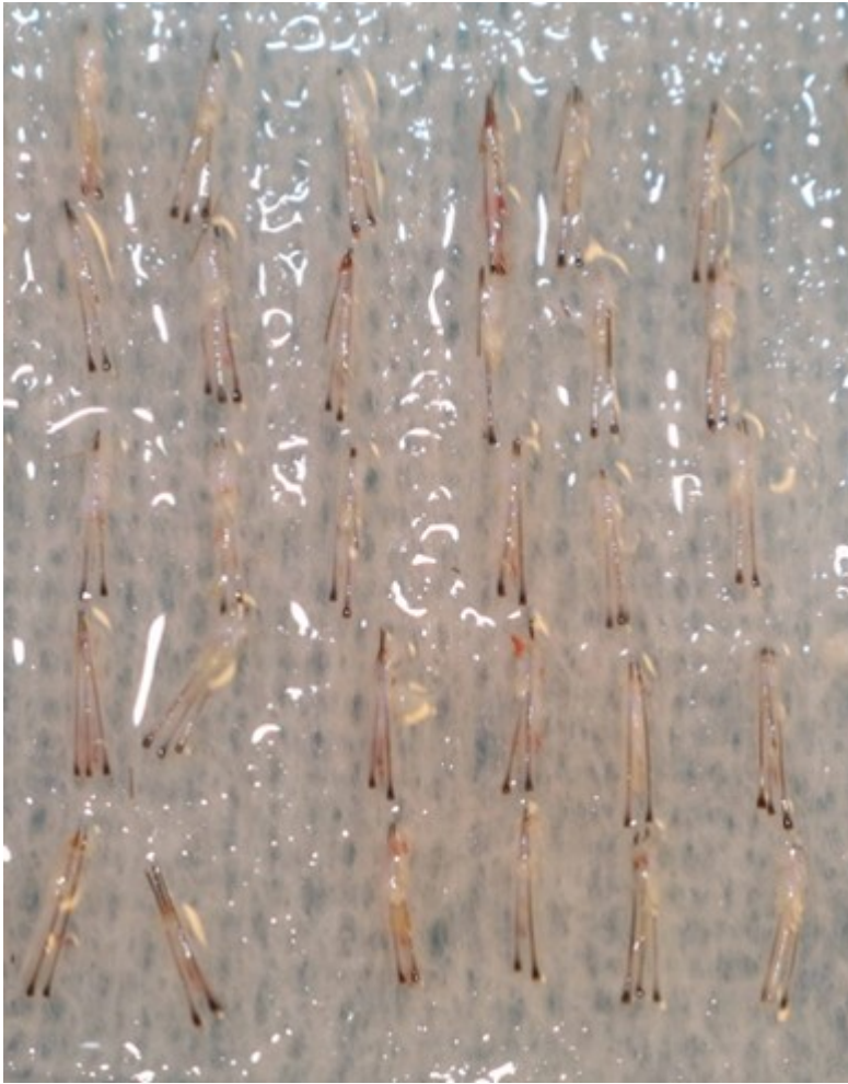
4) Schlitze für Implantate setzen.jpg , downloaded 850 times