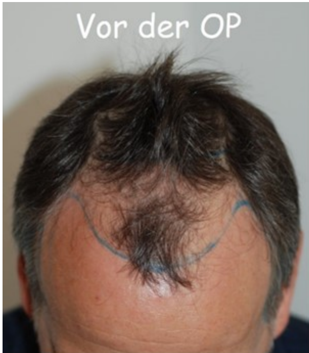
Vor der OP