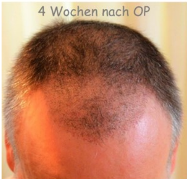
4 Wochen nach OP