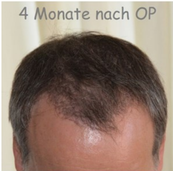
4 Monate nach OP