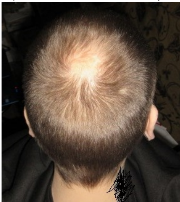
4) PRE seite.JPG , downloaded 991 times