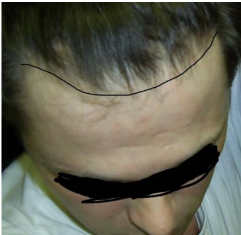
2) H 2.jpg , downloaded 696 times