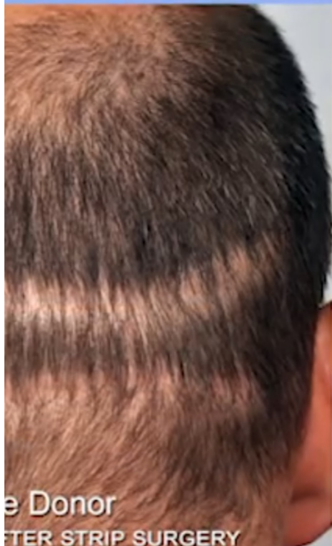
Donor AFTER STRIP SURGERY