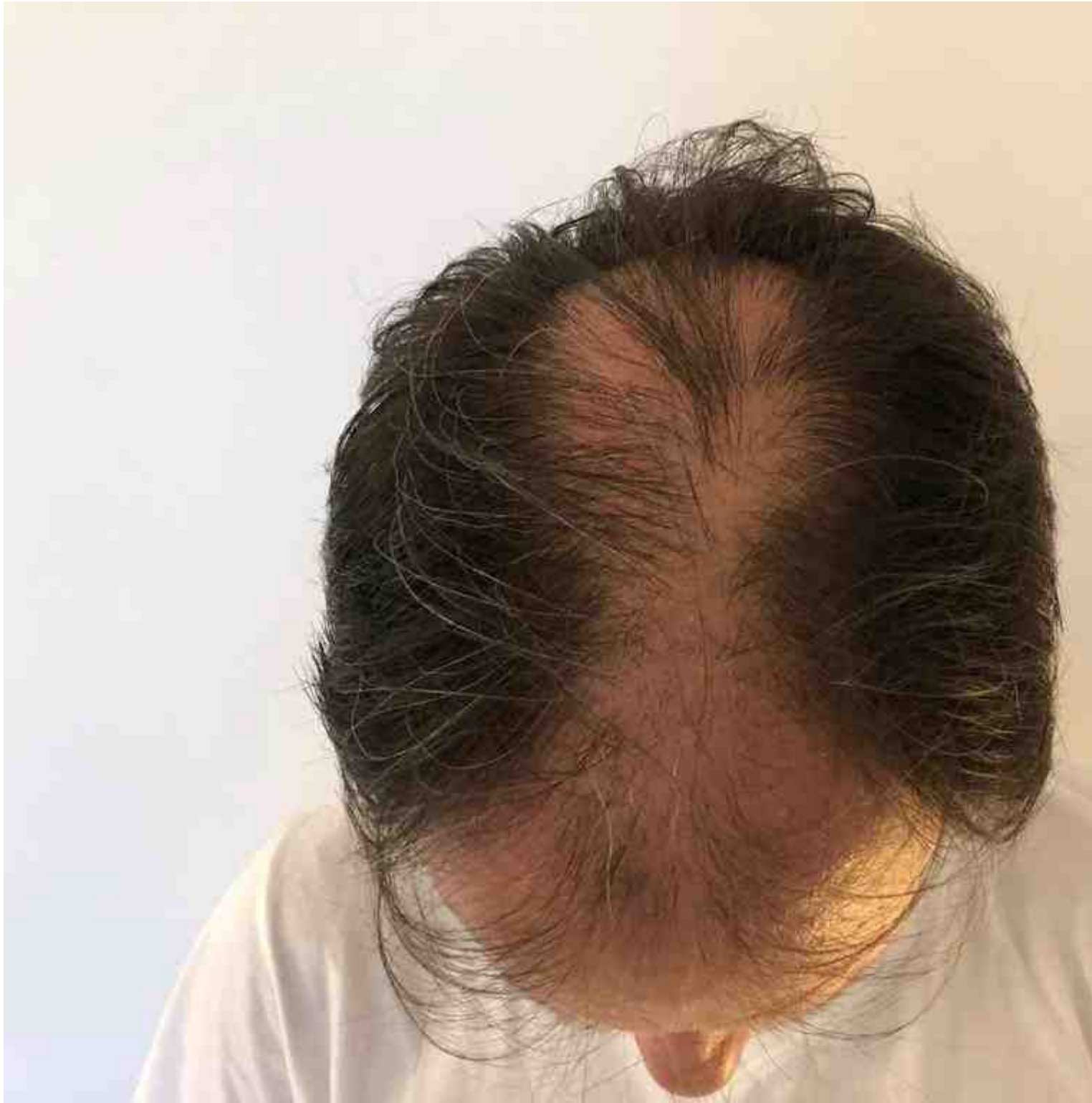
2) 2 Monate nach HT vorne.jpg , downloaded 1973 times