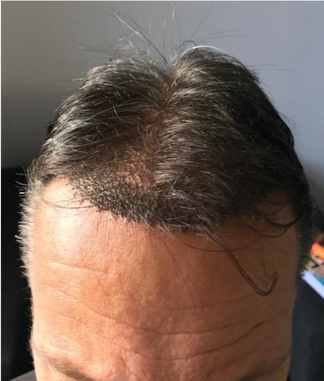
3) 1 Woche nach HT hinten.jpg , downloaded 721 times