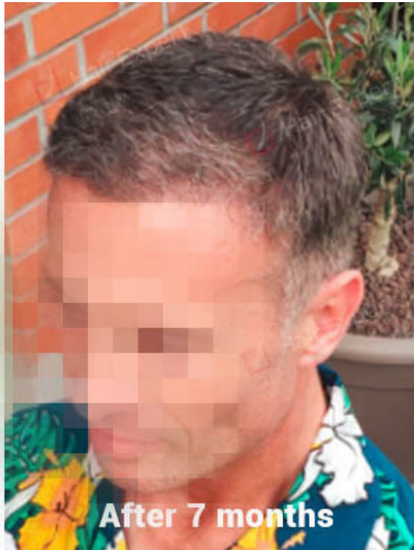
After 7 months