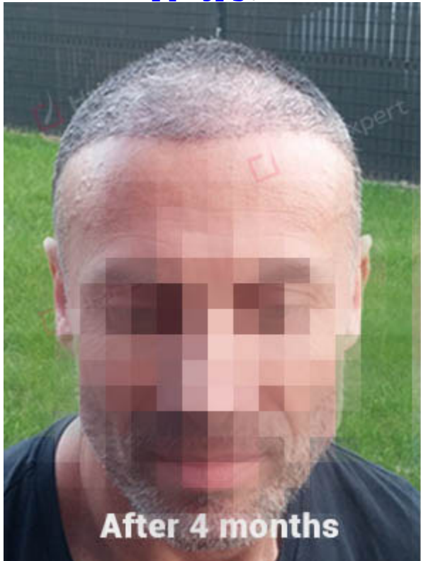
After 4 months