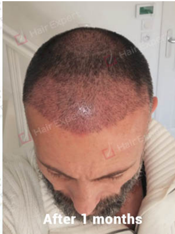
After 1 months