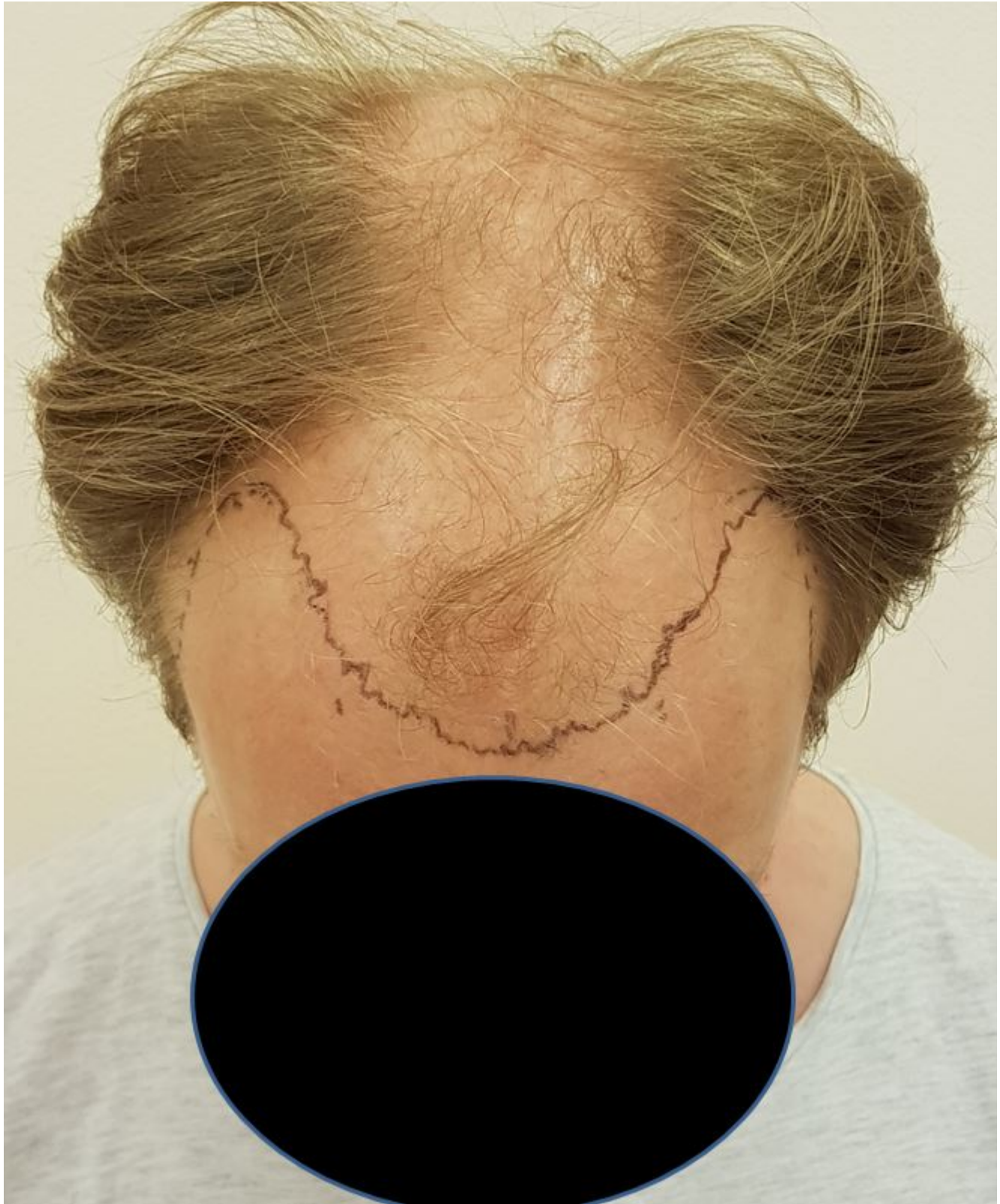
4) PreOPside.JPG , downloaded 1825 times