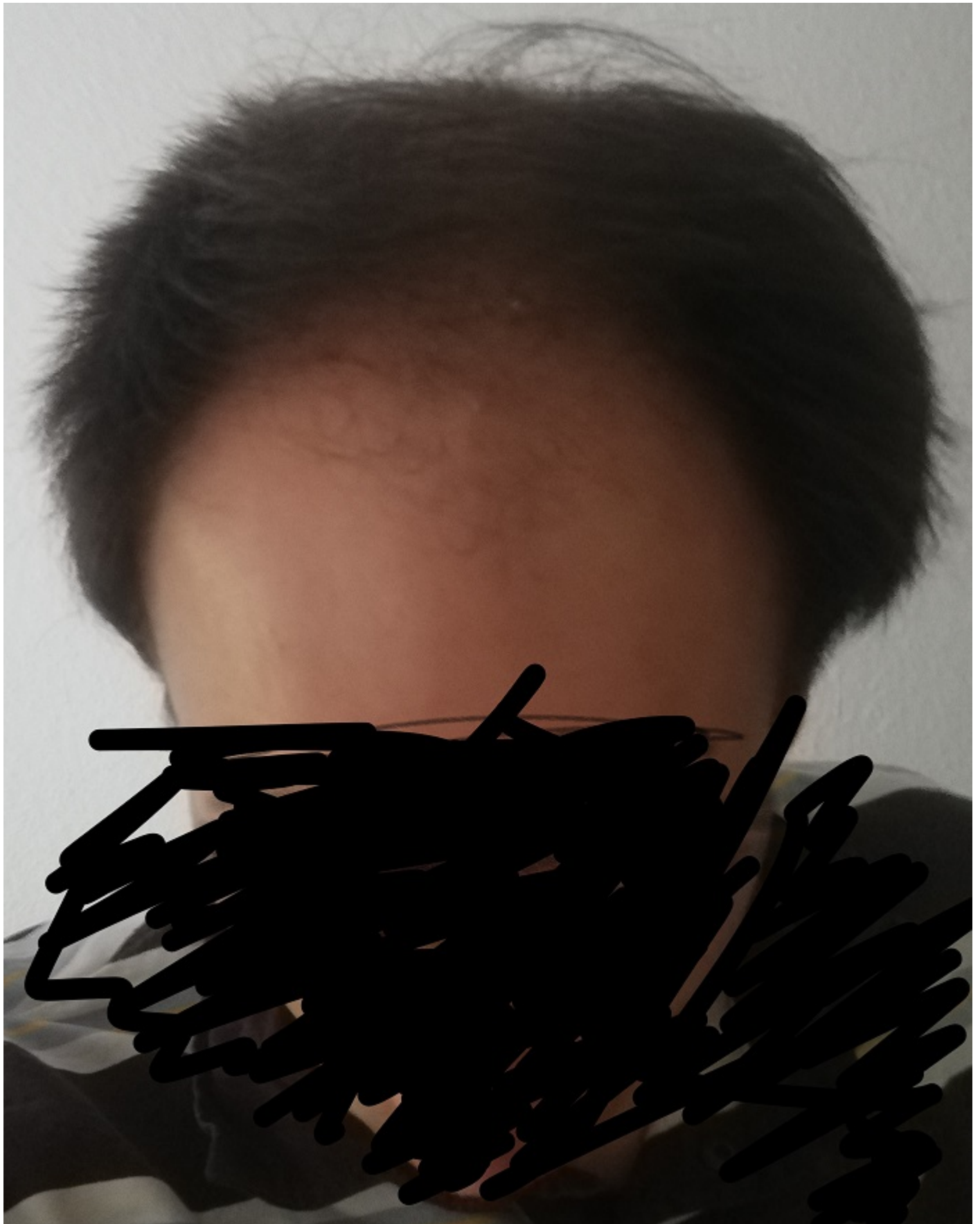
2) Bild_2.jpg , downloaded 543 times