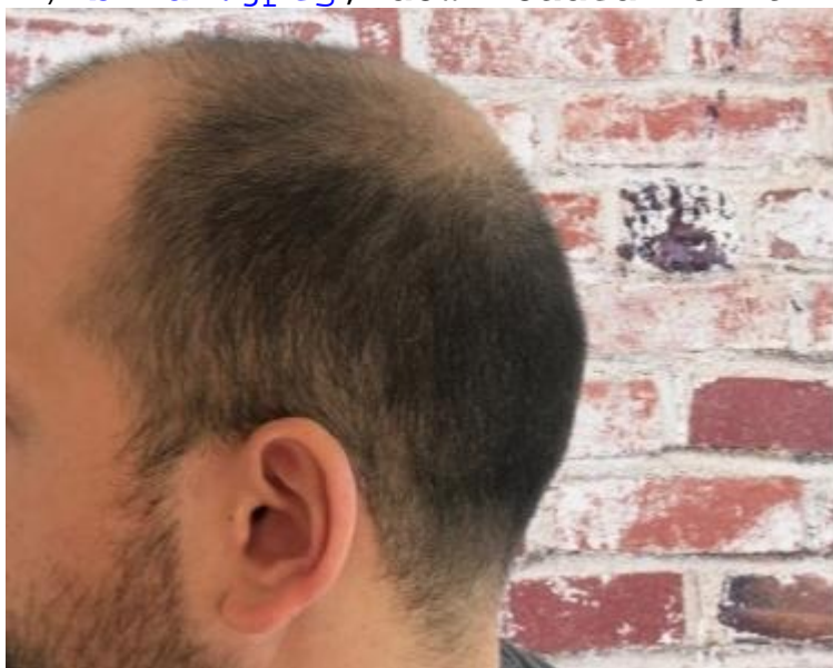
3) bild3.jpeg , downloaded 476 times