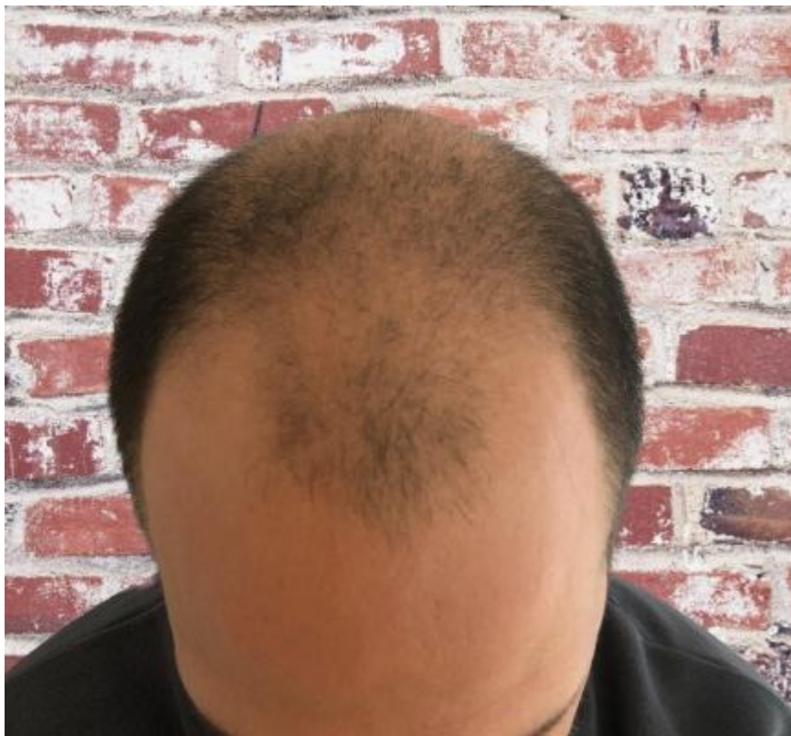
2) bild2.jpeg , downloaded 481 times