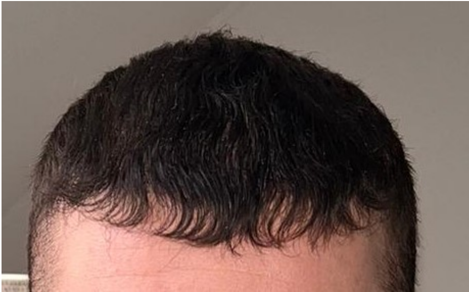
2) Bild2_seite_links.jpg , downloaded 320 times