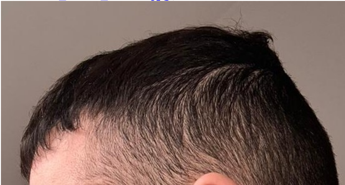
3) Bild3_seite_rechts.jpg , downloaded 297 times