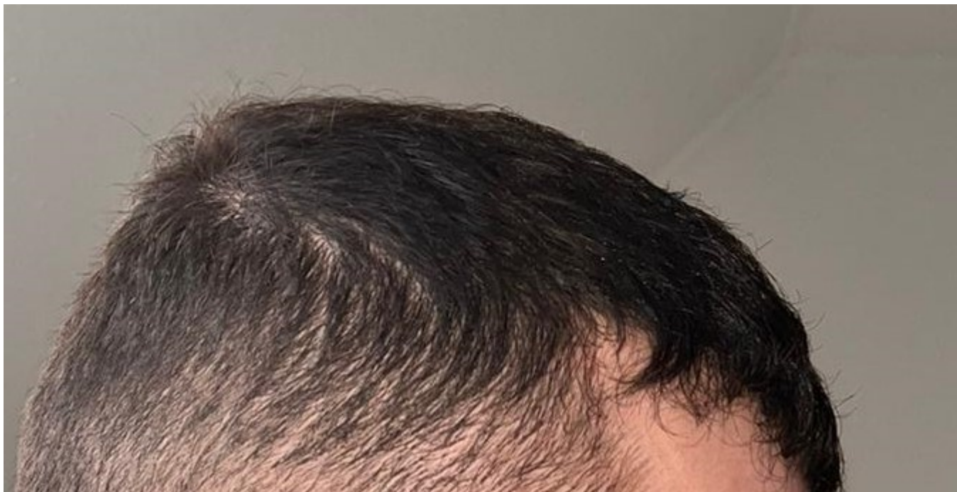
4) Bild4_hinten.jpg , downloaded 302 times