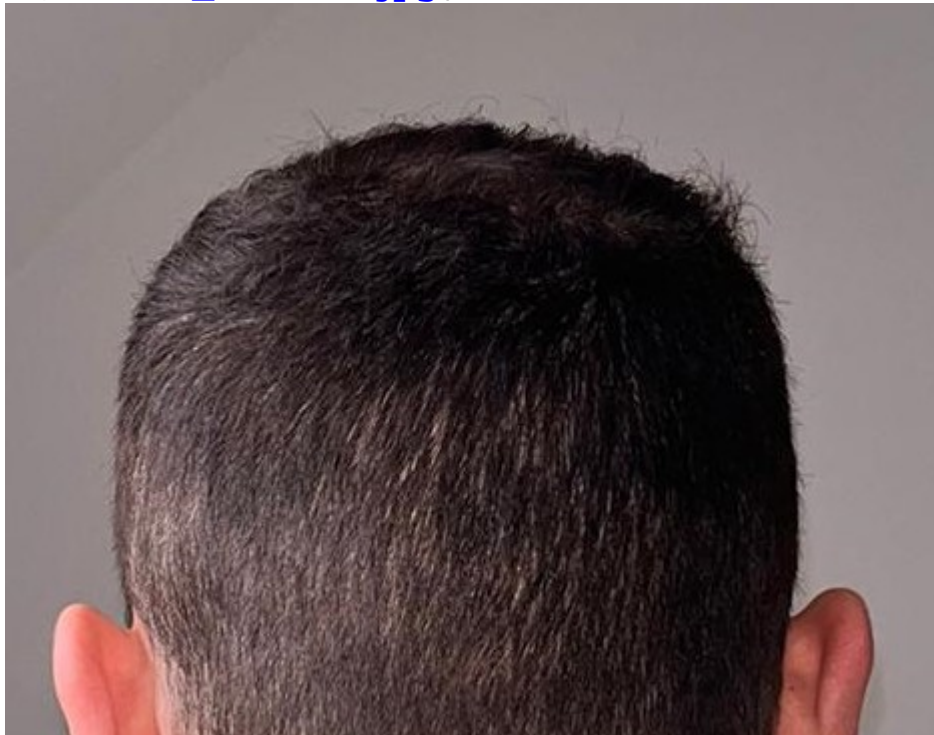
5) Bild5_Haarlinie.jpg , downloaded 311 times