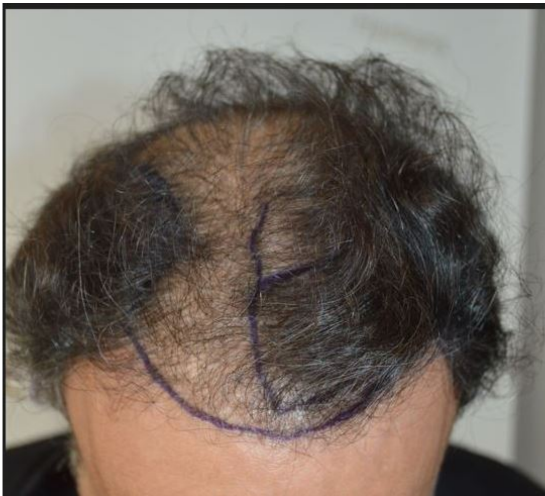
2) bild5.jpg , downloaded 1114 times