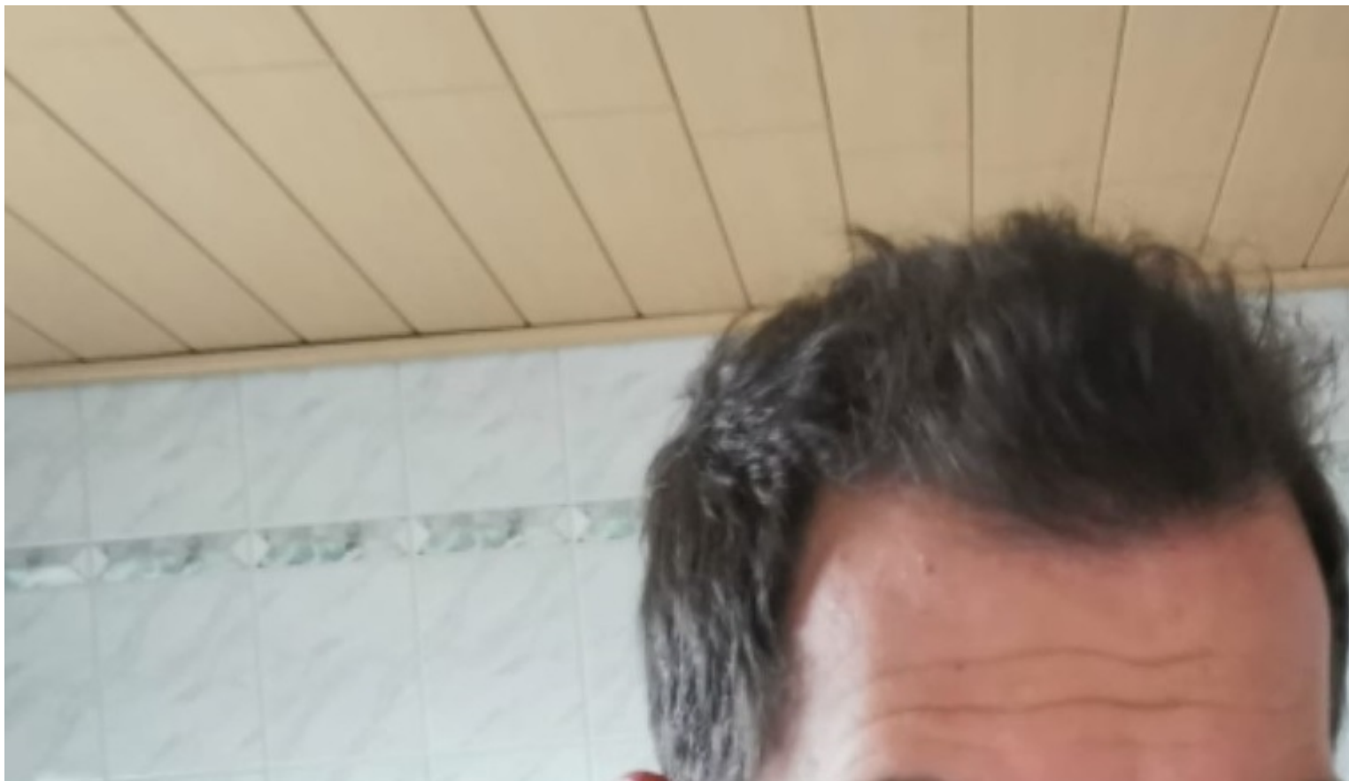
3) Papa + 1 Jahr nach OP.jpg , downloaded 1574 times