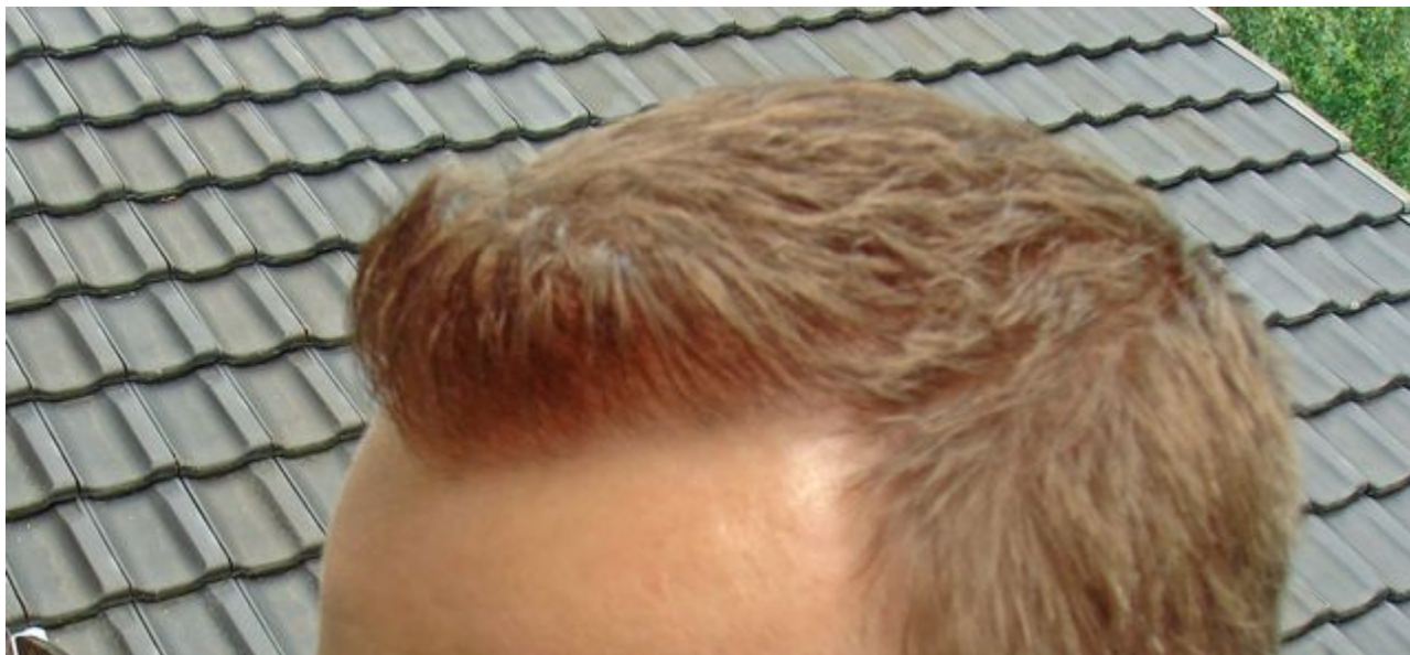
2) DSC02956_bearbeitet-1.JPG , downloaded 1977 times