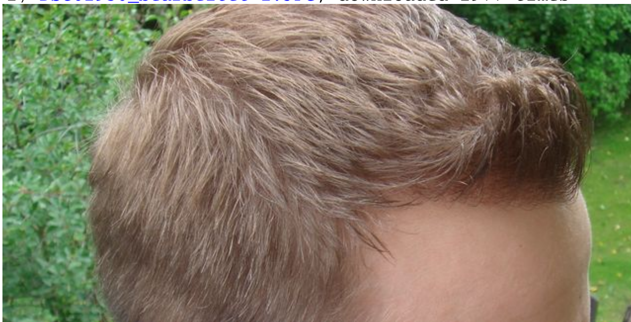
3) DSC02958_bearbeitet-1.JPG , downloaded 1971 times