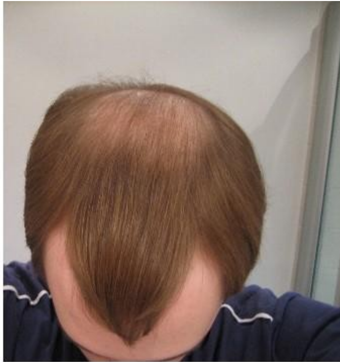
2) vergleich 3.JPG , downloaded 4638 times