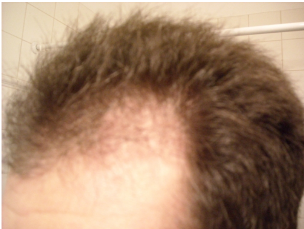
2) rechts.jpg , downloaded 1398 times