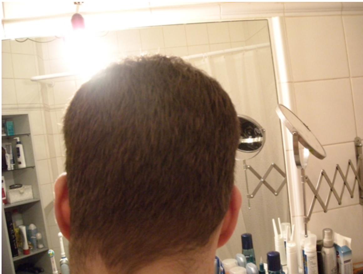
2) Hinterkopf 2.jpg , downloaded 1363 times