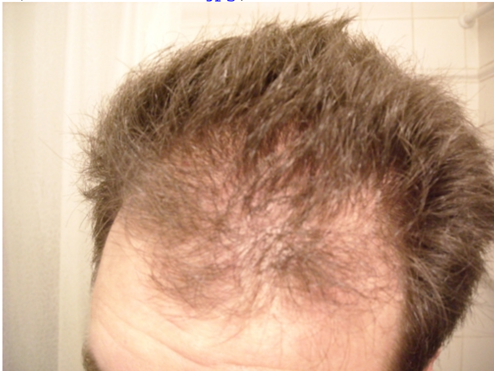
3) Front nach unten frisiert.jpg , downloaded 2218 times