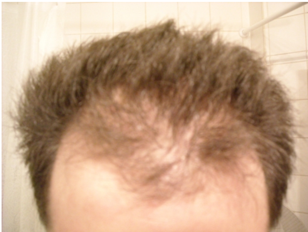
2) Frontansicht 2.jpg , downloaded 2199 times