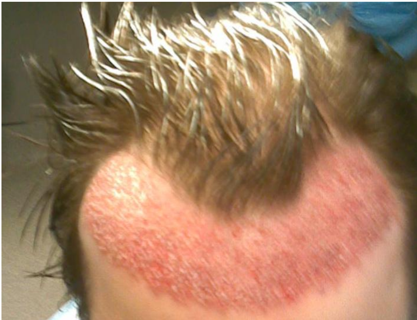
2) haarlinie.JPG , downloaded 2487 times