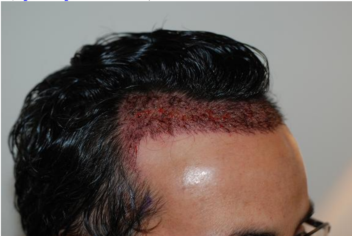
3) haarlinie-post-op-von-oben.JPG , downloaded 2456 times