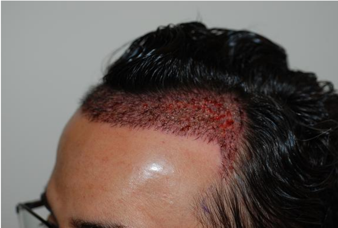
2) post-op-rechts.JPG , downloaded 2406 times