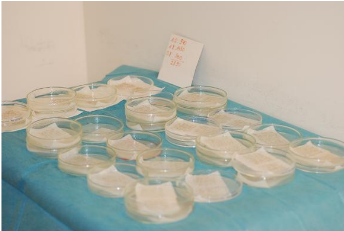
2) dichtemessung.JPG , downloaded 2459 times