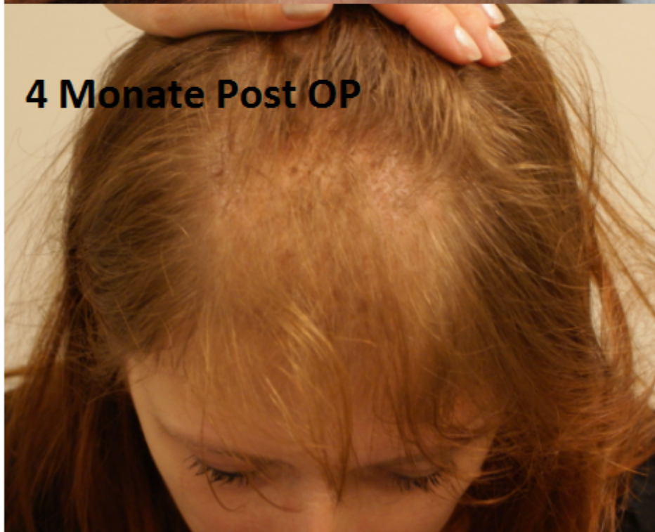
4 Monate Post OP