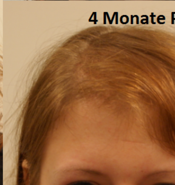
4 Monate Post OP

Subject: Aw: 4 Monate Post OP Hattingen für Frauen Posted by Nicolai on Wed, 27 Jul 2011 17:08:27 GMT View Forum Message <> Reply to Message