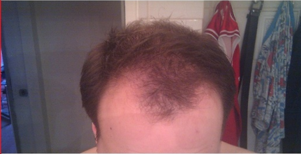
PRE OP Fotos