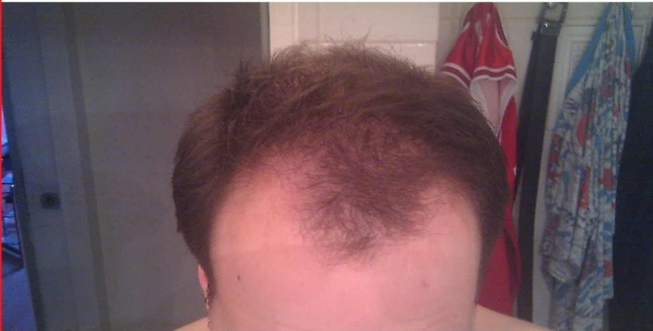
PRE OP Fotos