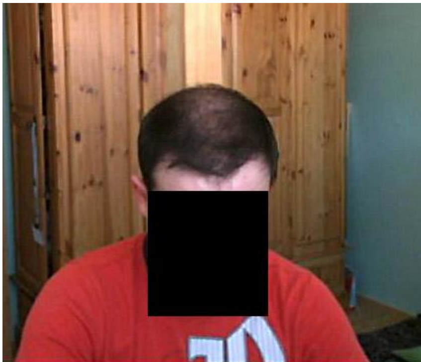
3) Bild 002.jpg , downloaded 397 times