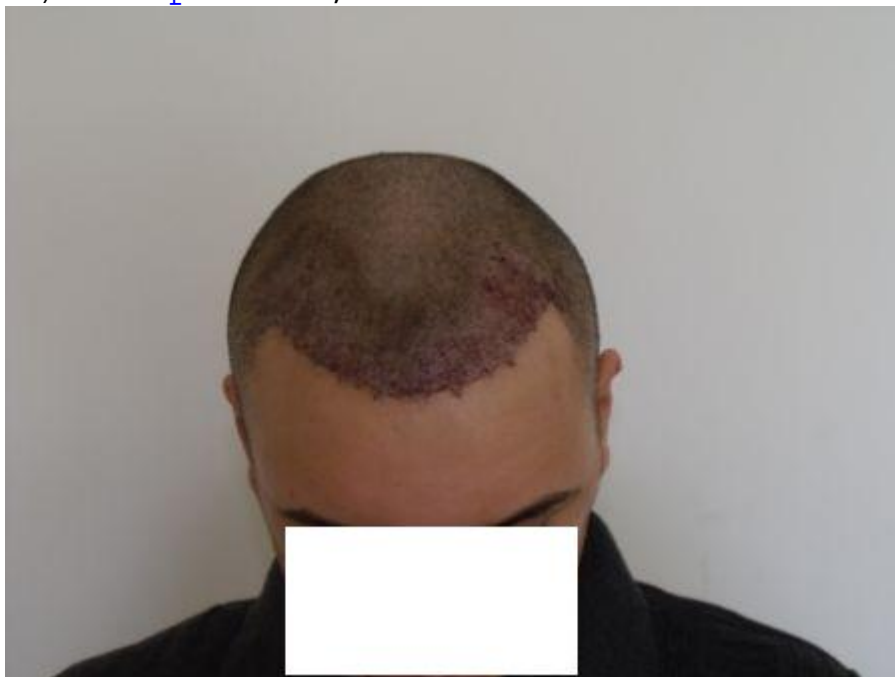
4) PreOp-4.JPG , downloaded 738 times