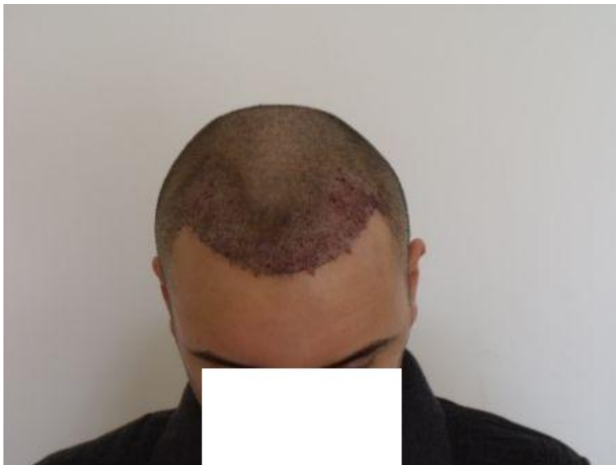
3) PreOp-3.JPG , downloaded 735 times