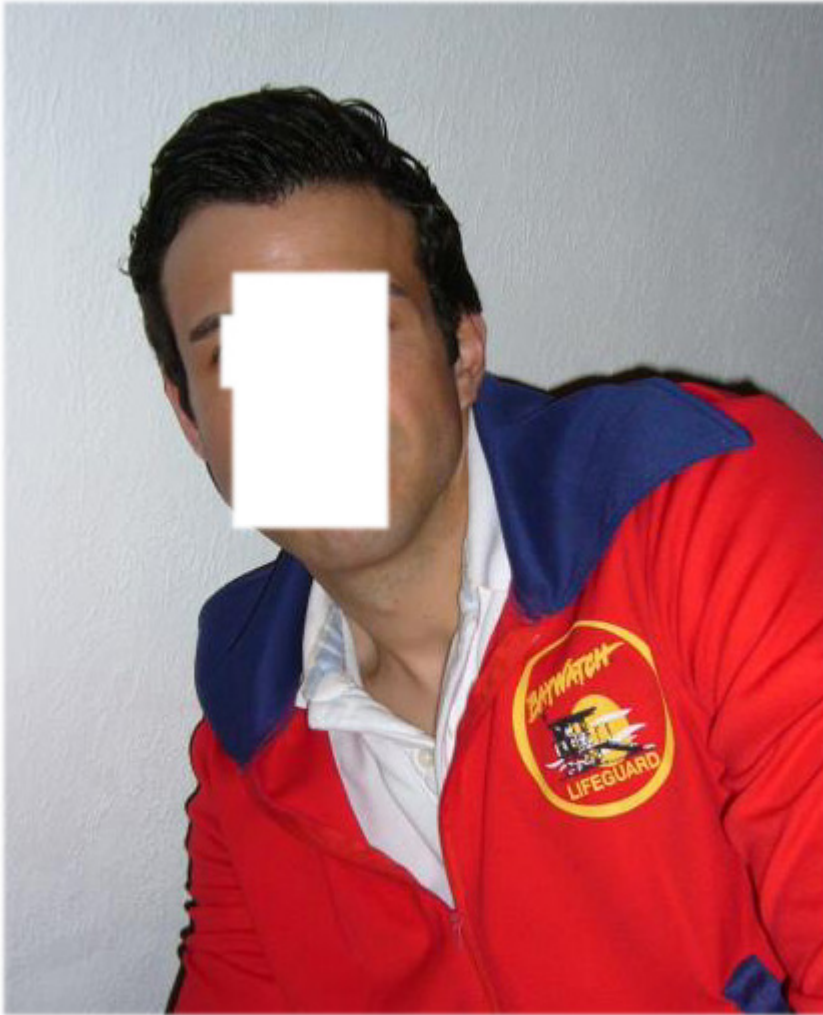
3) ich-mit21-anonym.jpg , downloaded 607 times