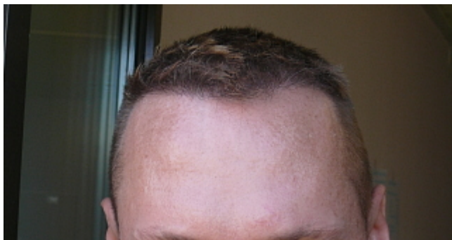
2) 19.Wo post3.jpg , downloaded 3178 times