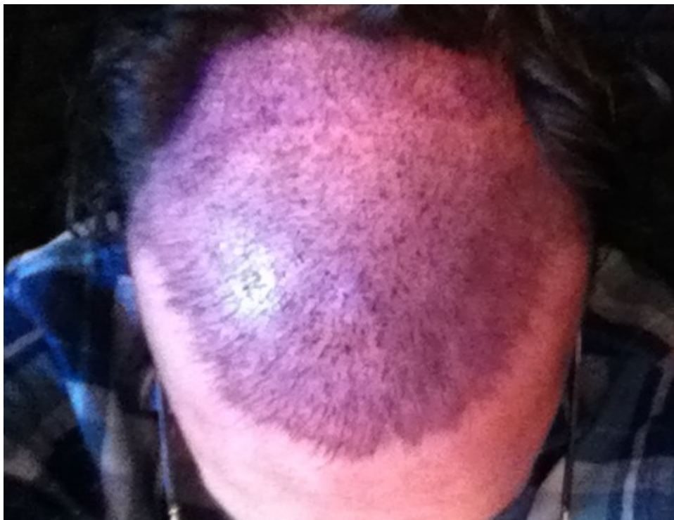
2) Vorher.jpg , downloaded 531 times