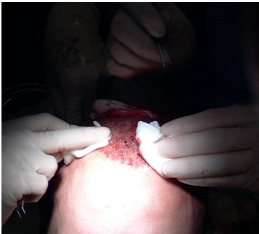
3) OP-VERBAND.png , downloaded 1701 times