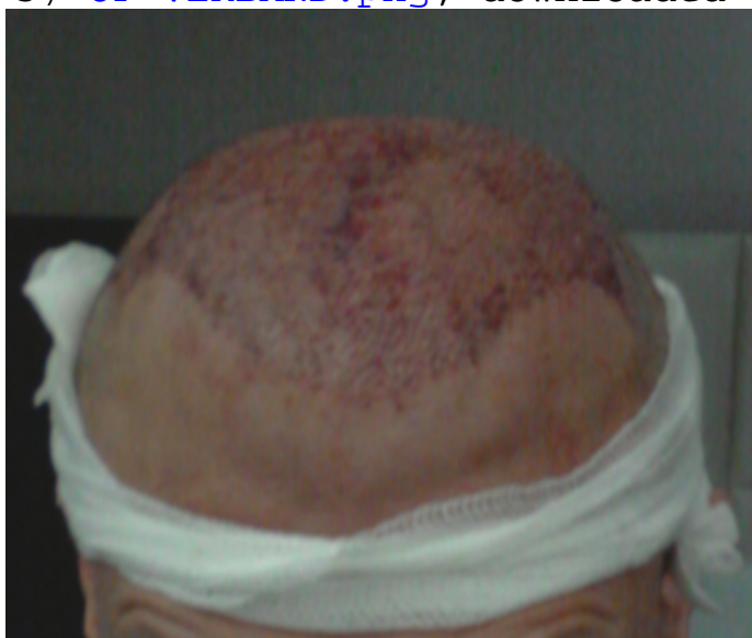
4) 3.Tag Post-OP Front.png , downloaded 2691 times