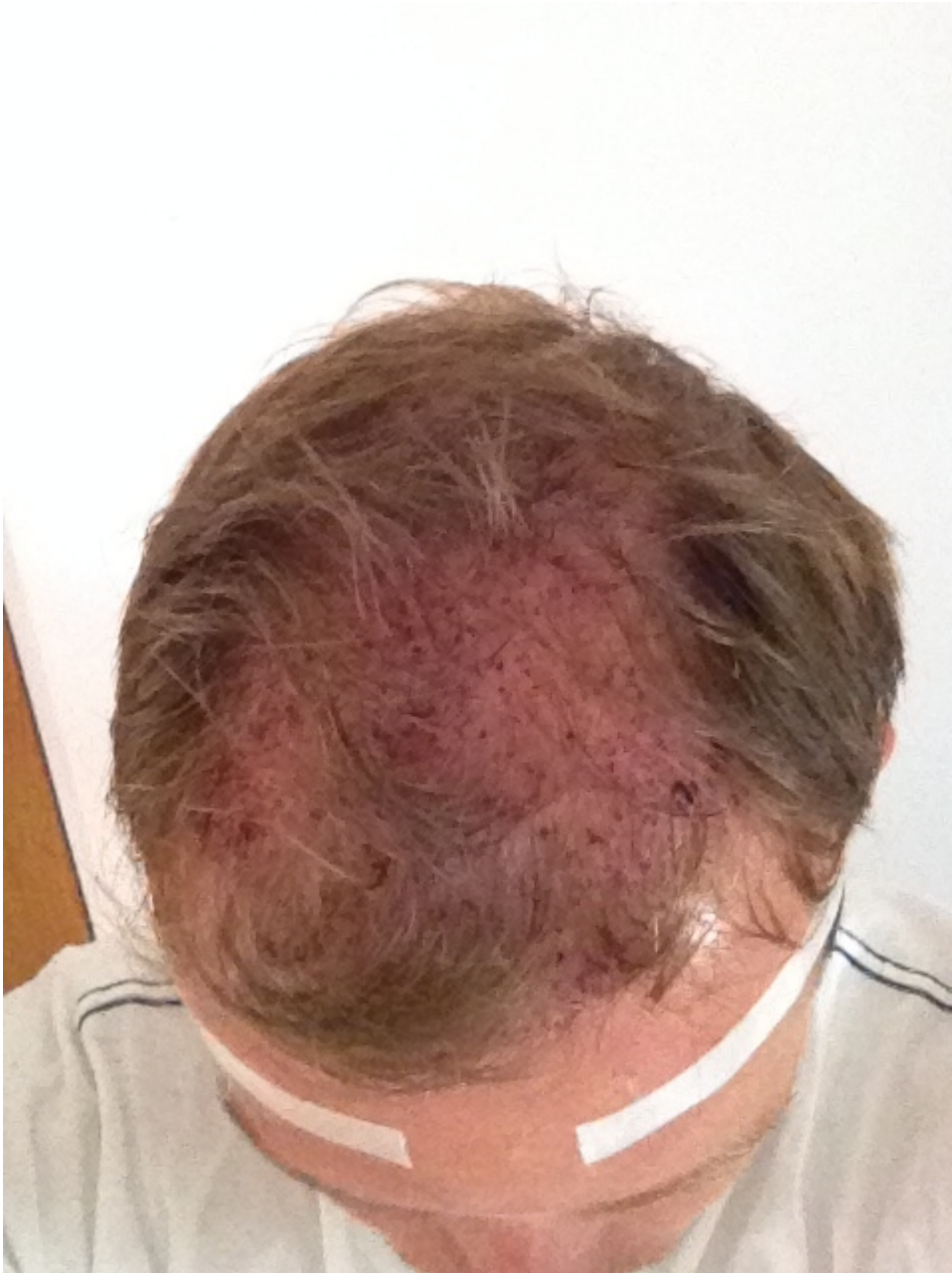
2) IMG_0475.jpg , downloaded 1776 times