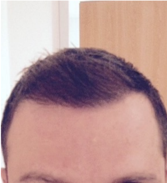
2) image.jpg , downloaded 700 times