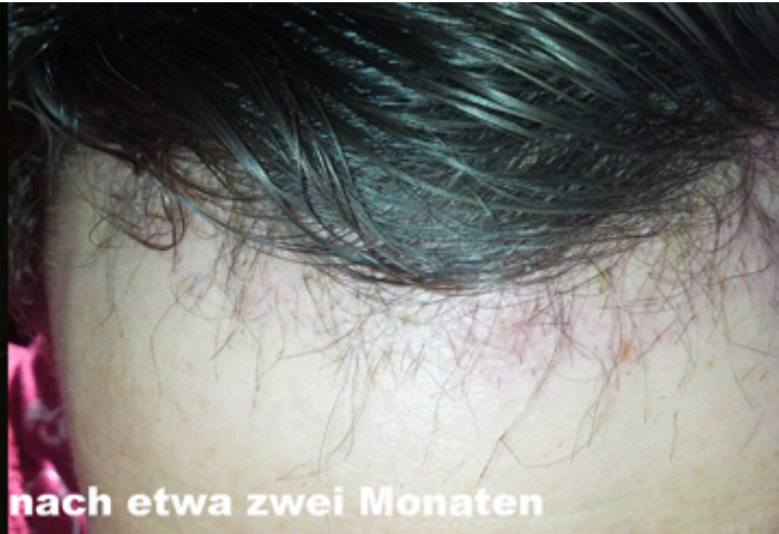
nach etwa zwei Monaten

Subject: Aw: Haartransplantation in Istanbul - Erfahrungsbericht mit Fotos