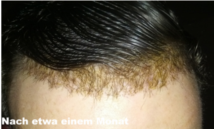
Nach etwa einem Monat