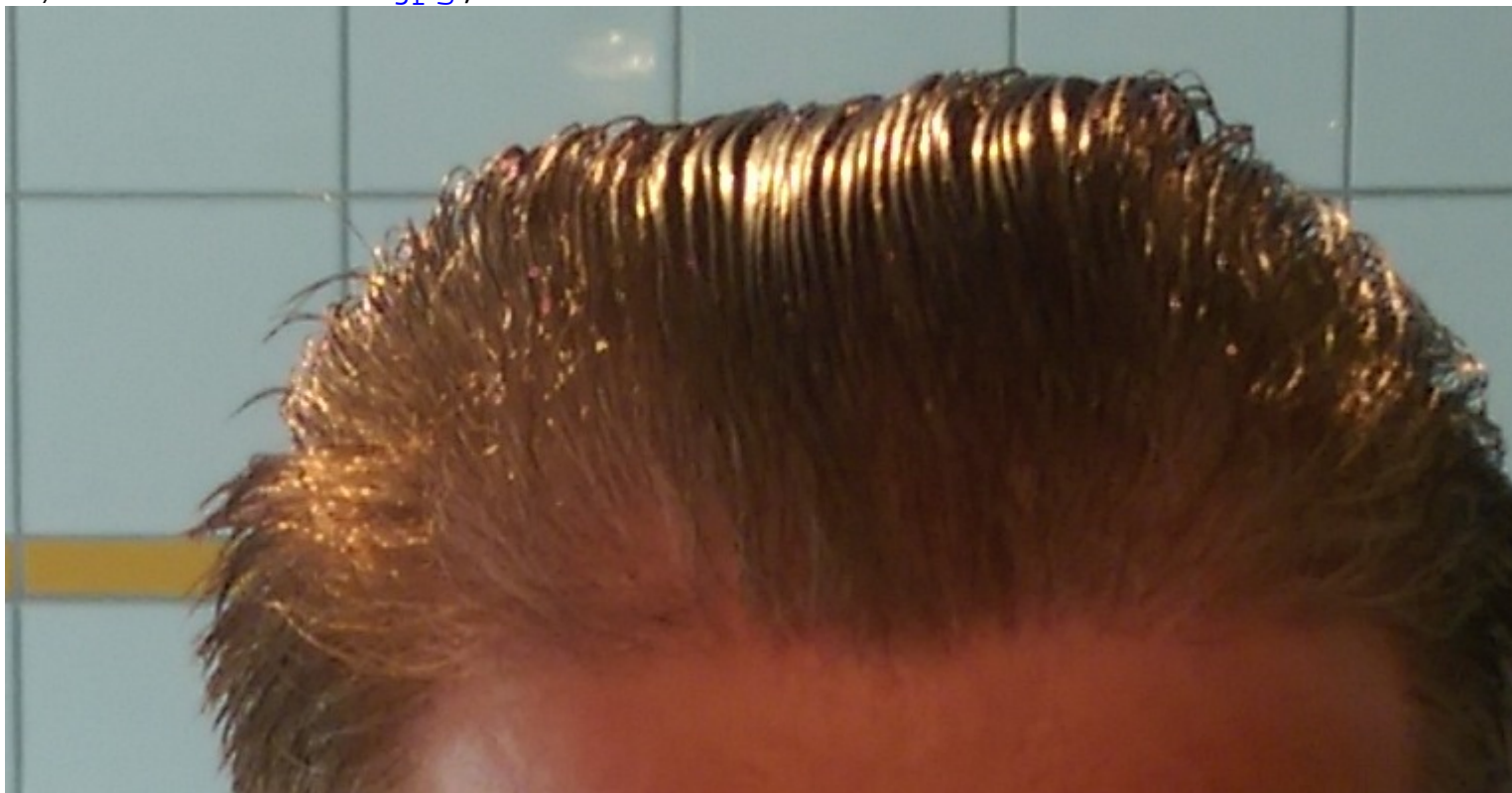
3) 21.06.15 halbtrocken.jpg , downloaded 1084 times