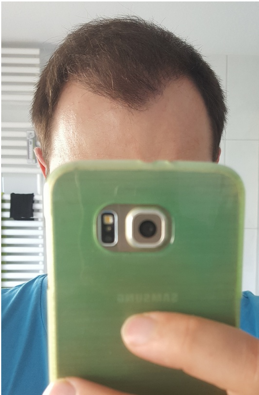
4) 5_Monat_post_vorne.jpg , downloaded 849 times