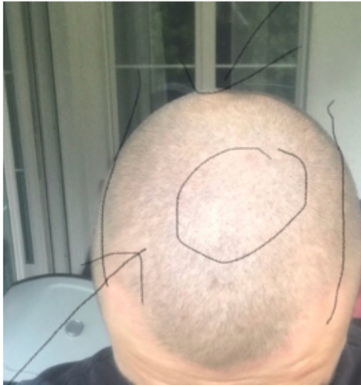
2) 2203F56D-99AA-4838-9EAA-11E29E78B3B2.jpeg , downloaded 566 times