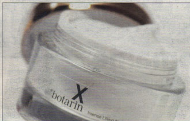
Natürliche Faltenbremse Botarin – durch Muskelentspannung zu glatter Haut

Sanfte Alternative: Österreicher revolutioniert den Kosmetikmarkt mit einzigartiger Anti-Falten Creme. Sensation: Kosmetikinnovation Botarin ist knapp drei Monate nach dem Start die meistverkaufte Anti-Aging Pflege Österreichs.