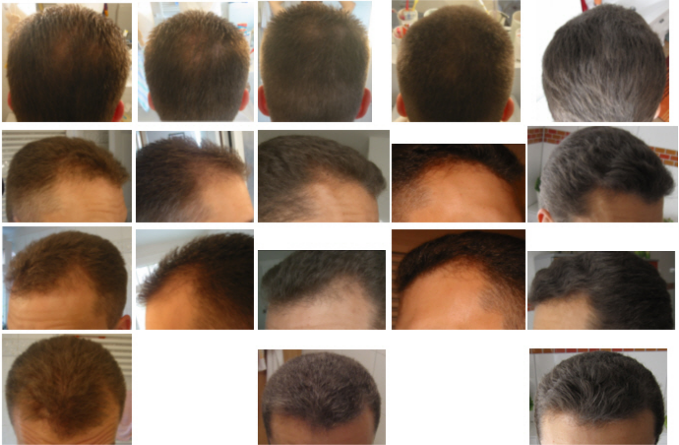
Haarwachstumsverlauf nach ca. 4 Monaten verstärkter Minoxanwendung