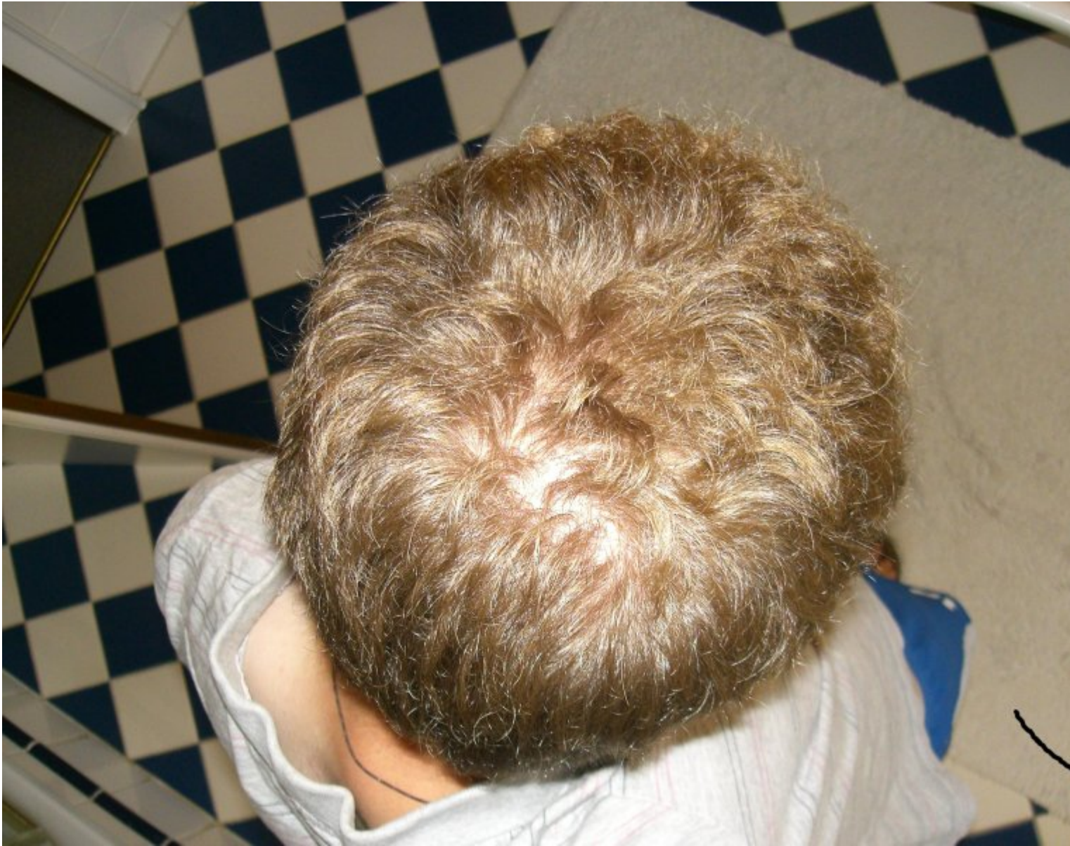
2) Hinterkopf mit Blitz 2.JPG , downloaded 551 times