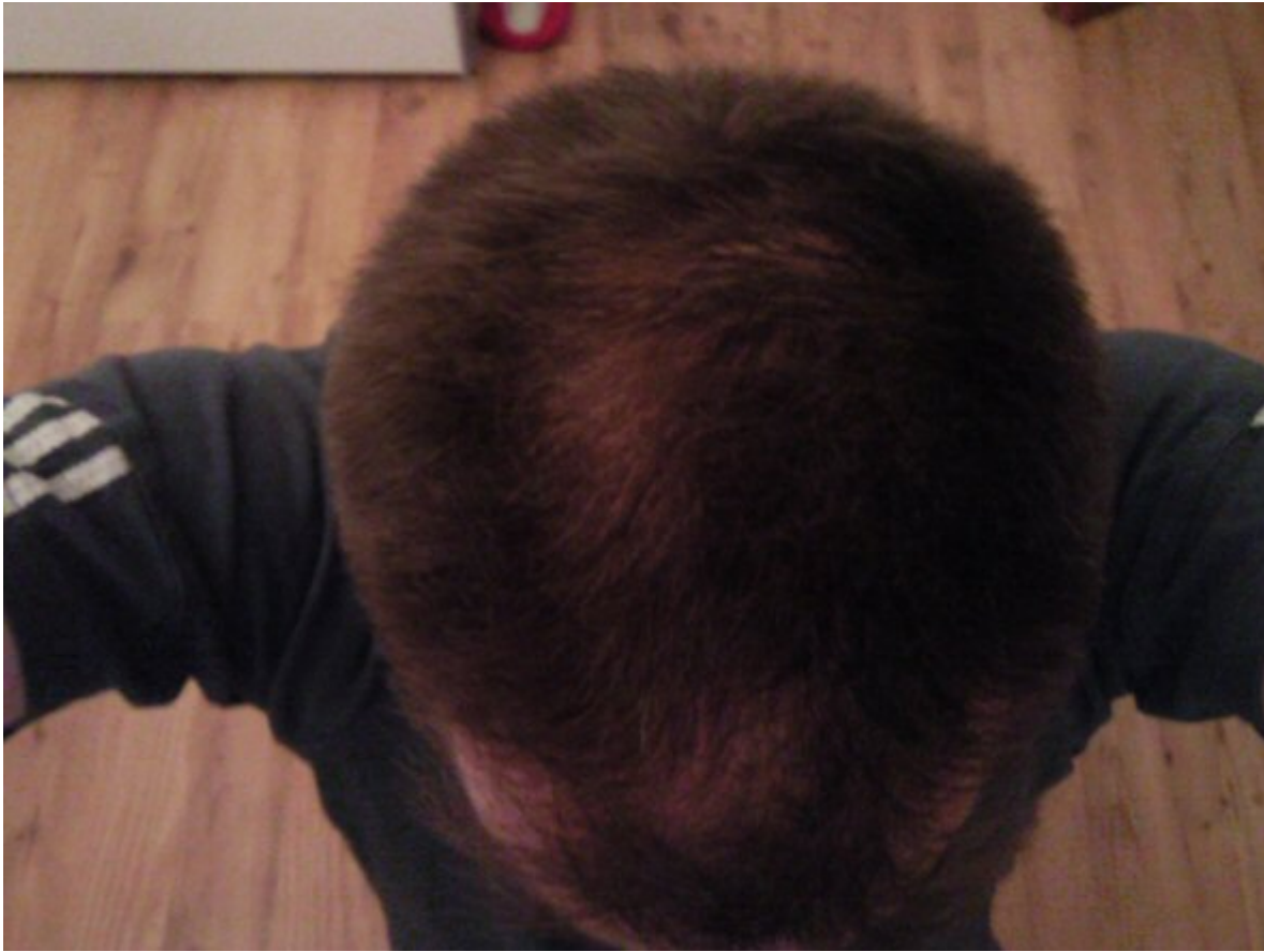
3) mit Toppik.jpg , downloaded 1026 times