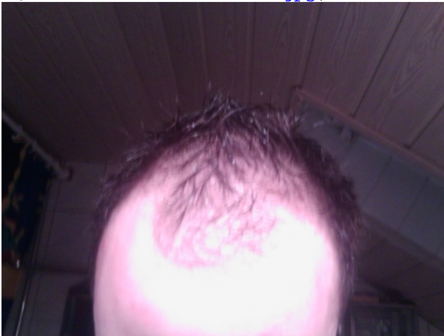
3) 2011 oben nass 11111.jpg , downloaded 10218 times