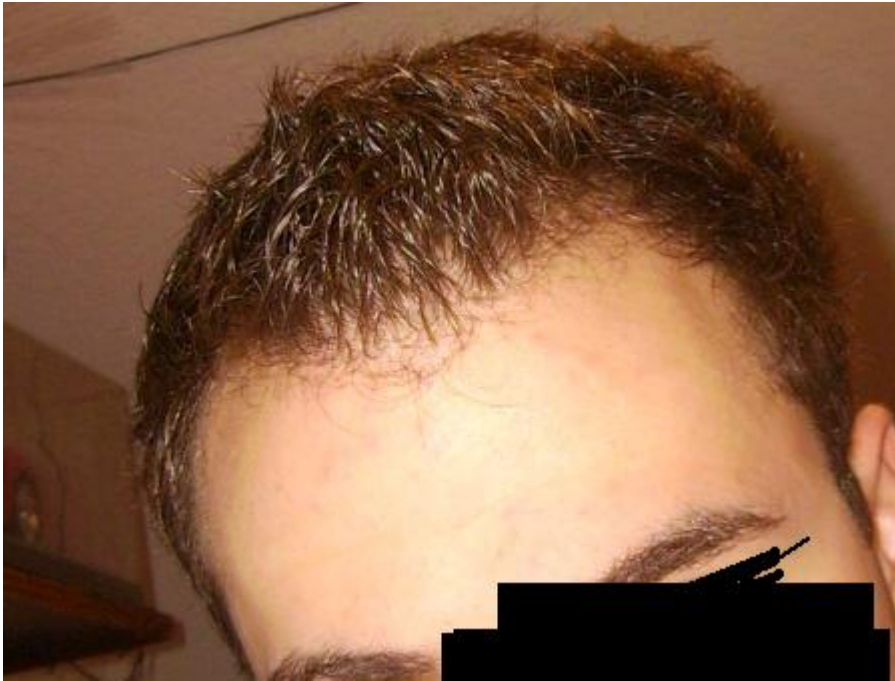
2) 2006 mit 17 kurze haare seite.JPG , downloaded 11341 times