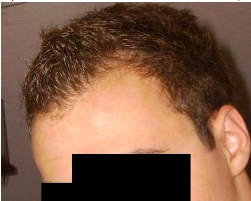
3) 2011 front 2.jpg , downloaded 11337 times