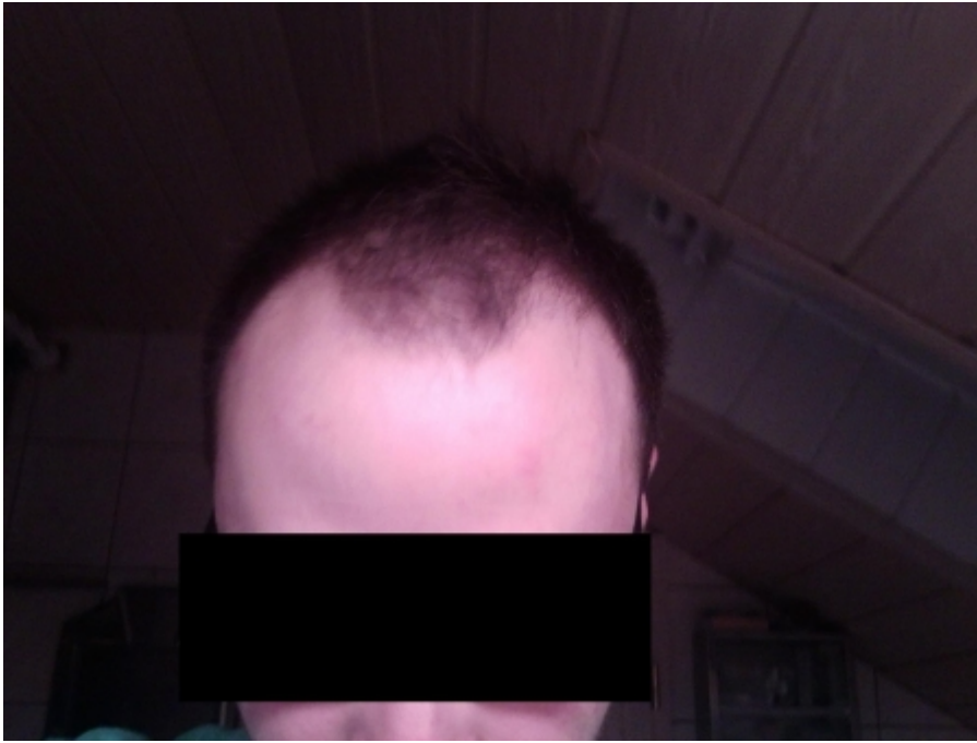
2) 2011 front nass 11111.jpg , downloaded 10271 times