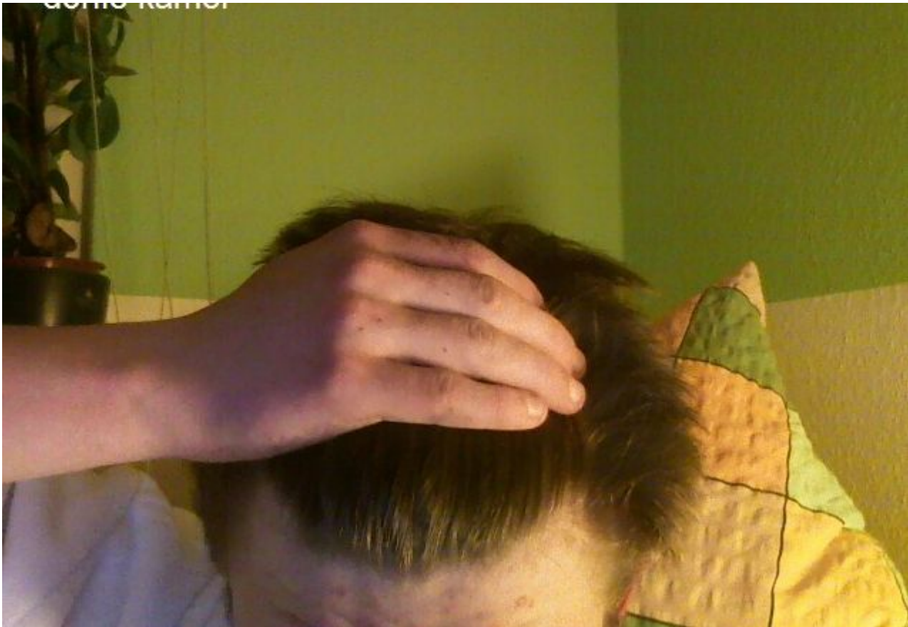
2) ansatz2.jpg , downloaded 371 times