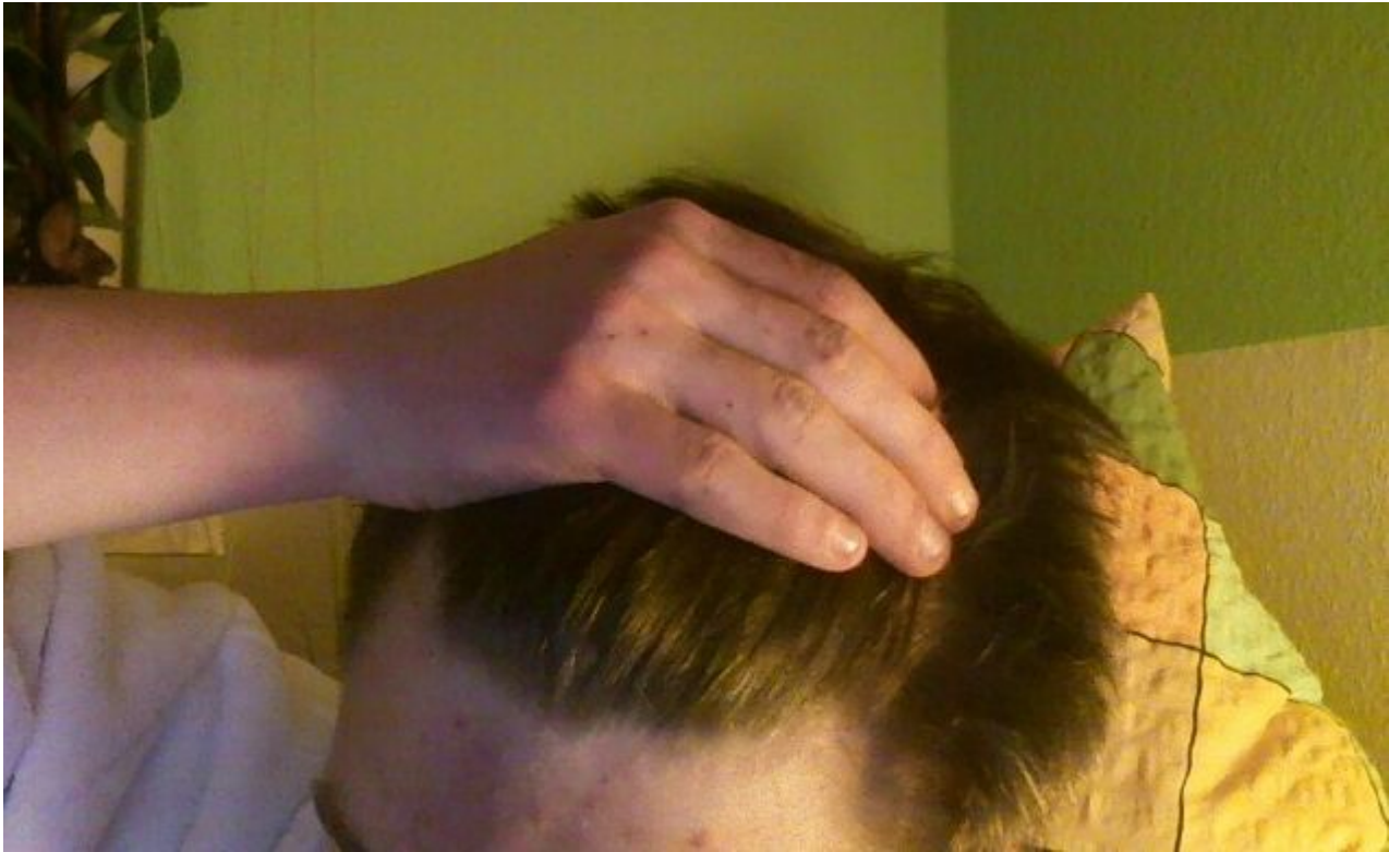
3) ansatz3.jpg , downloaded 2297 times