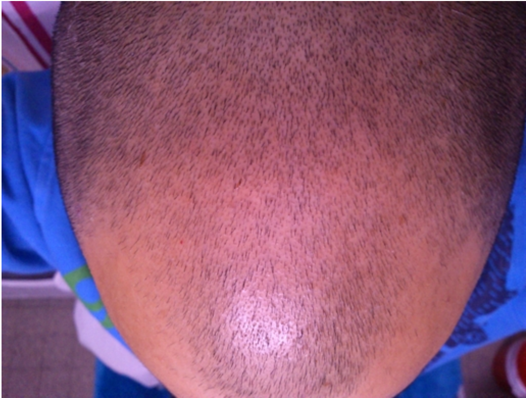
3) DSC_0043.JPG , downloaded 573 times