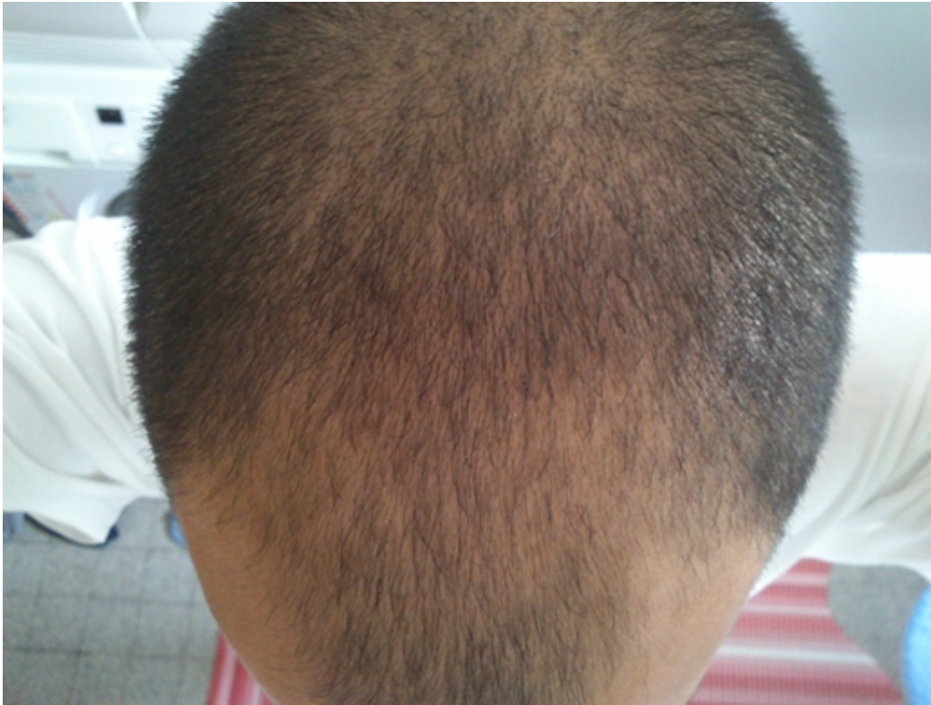
3) DSC_0056.JPG , downloaded 3928 times