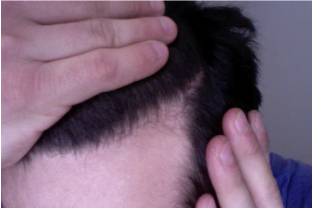
2) Foto am 04.01.12 um 14.45 #4.jpg, downloaded 1081 times