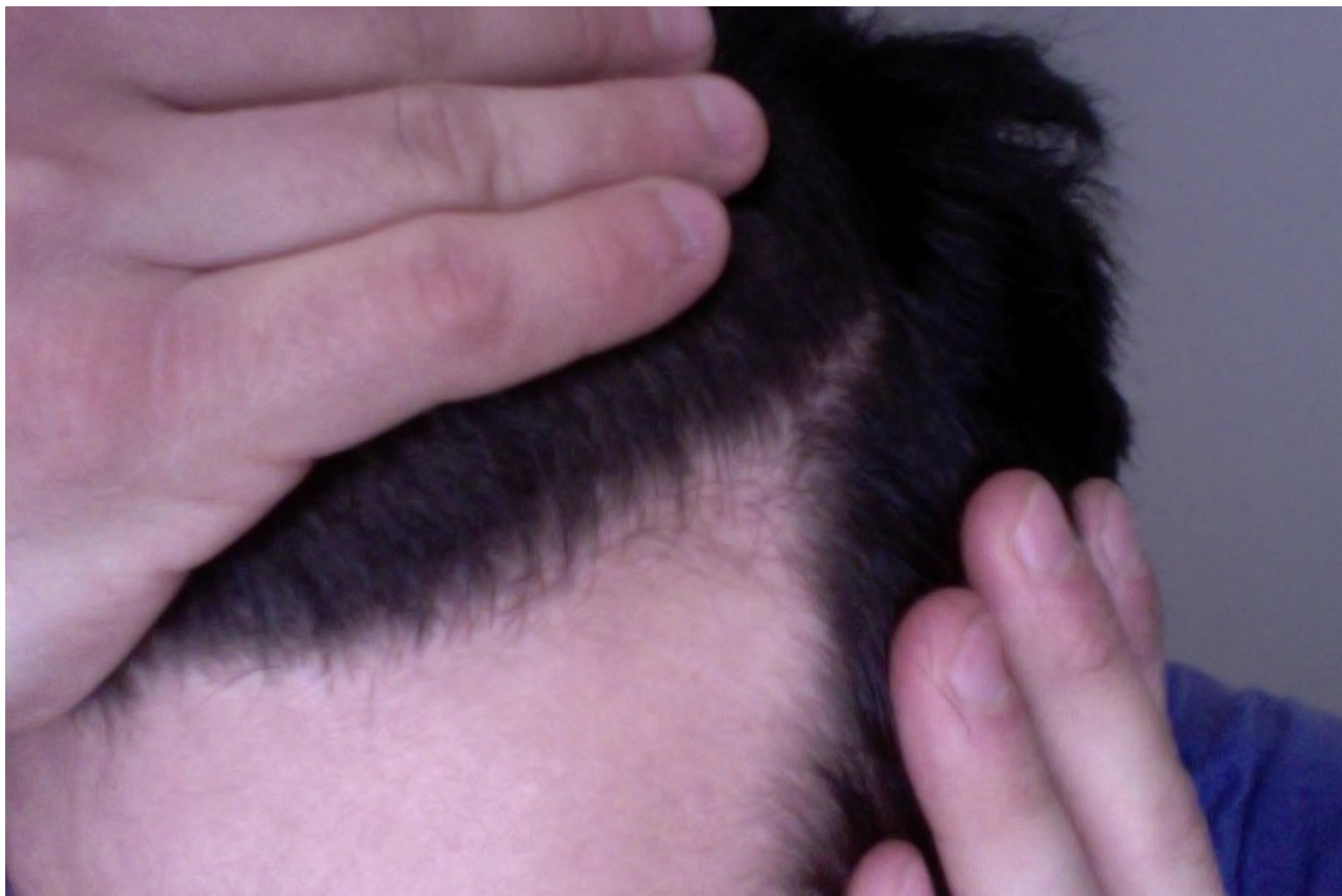
2) Foto am 04.01.12 um 14.45 #4.jpg, downloaded 1042 times