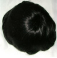
Color #1 Jet Black