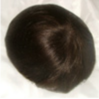
Color #6 Medium Brown