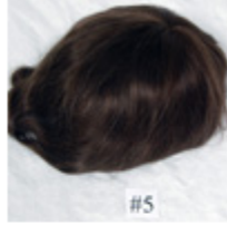
Color #5 Medium Brown