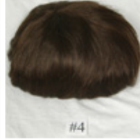
Color #4 M Dark Brown