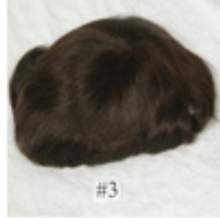
Color #3 Dark Brown