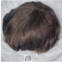
Color #18 Blonde