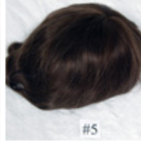
Color #5 Medium Brown