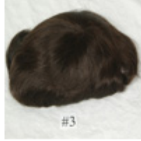
Color #3 Dark Brown