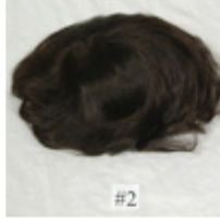
Color #2 Dark Brown