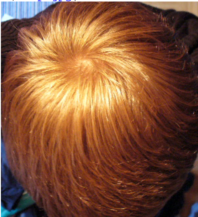
3) GHE.jpg , downloaded 479 times