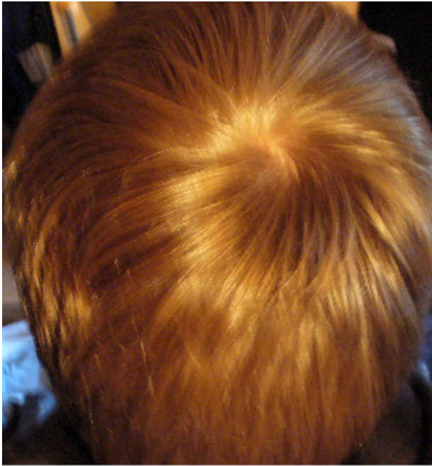
2) Top.jpg , downloaded 522 times