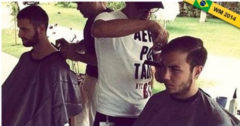
Schön machen fürs Finale: Mario Götze (r.) und Skhodran Mustafi