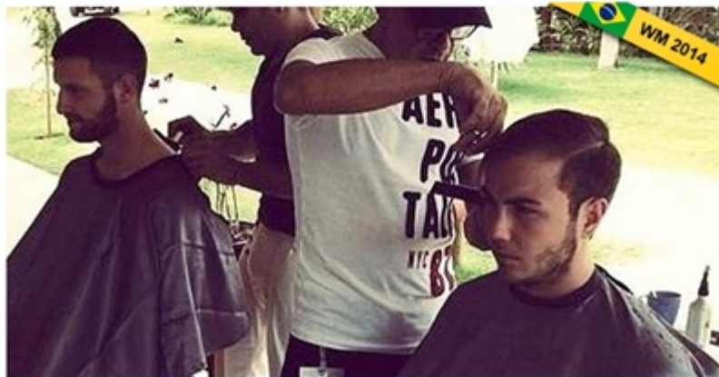
Schön machen fürs Finale: Mario Götze (r.) und Shkodran Mustafi