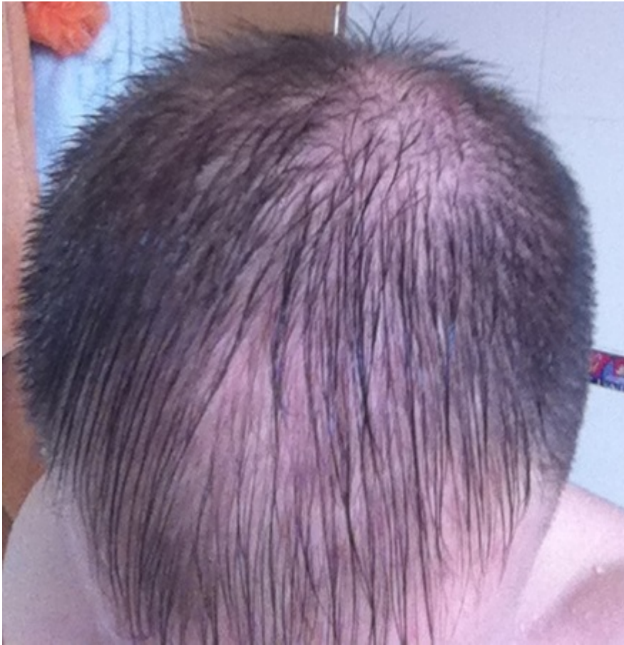
3) Seitel_Nov13.jpg , downloaded 329 times