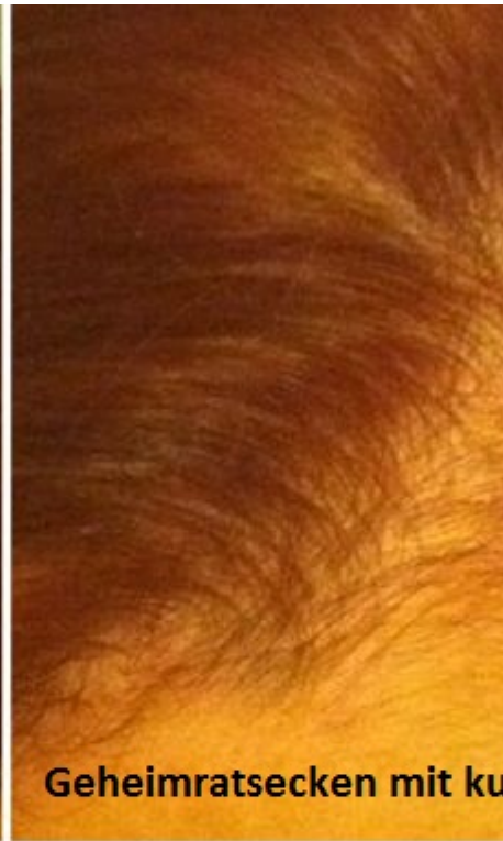
Geheimratsecken mit ku