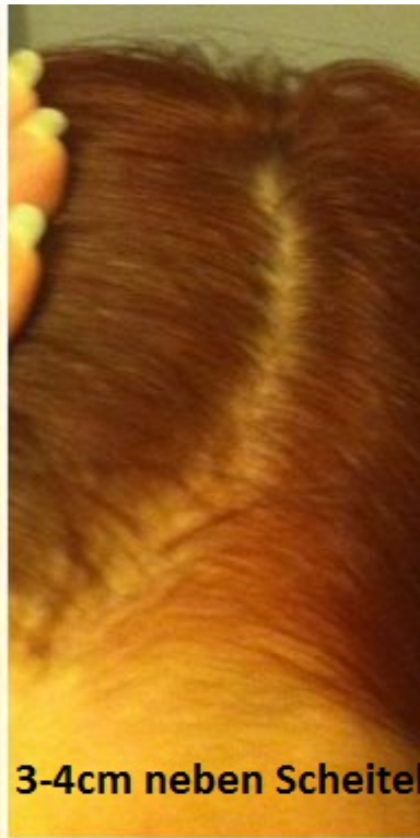
3-4cm neben Scheitel