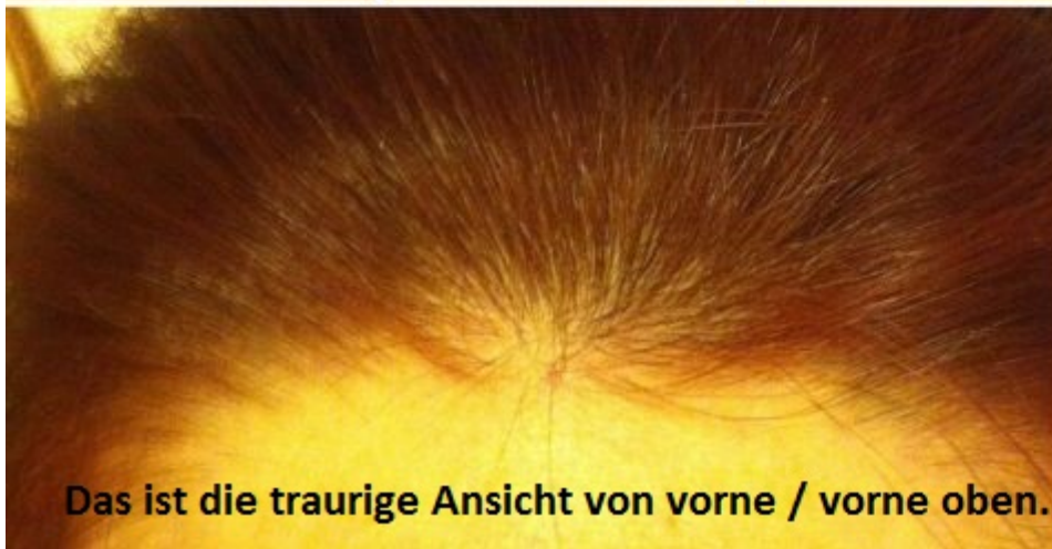
Das ist die traurige Ansicht von vorne / vorne oben.....