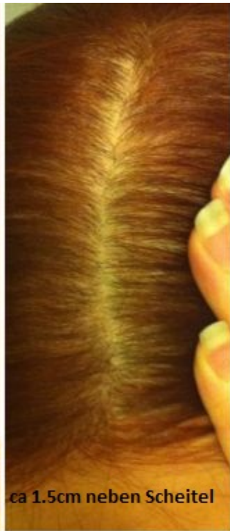
ca 1.5cm neben Scheitel