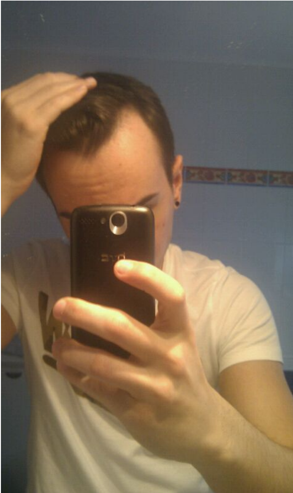
2) IMAG1399.jpg , downloaded 574 times